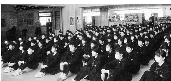
3学期の決意を聞く生徒たち

1月10日、44日間の3学期がスタートしました。始業式では、各学年の代表生徒から3学期の決意が発表されました。 「3学期は先輩になるための準備をきちんと進めていきたいです。そのために、あいさつや時間に対する意識を高め、学習面も授業や家庭学習にしっかりと取り組みたいです。自立した行動を目指し、仲間との絆を大切にしたいです。」