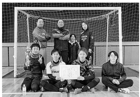
優勝した祇園サベドリアのメンバー

10区は唯一、全種目に参加し11月の親子ピンポン大会で3位になり総合1位に躍り出て、その後も着実に得点を積み重ね、他行政区の追従を許さないという展開でした。 各行政区とも子どもから大人まで一生懸命にプレーした姿が印象的でした。 総合成績表彰は、2月17日(日)に「生涯学習市民のつどい」で行われます。 なおフットサル大会の結果