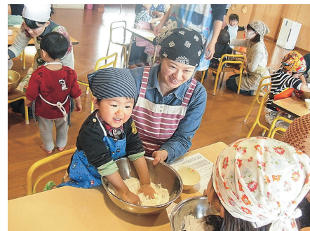
親子で楽しくクッキング