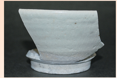
中国産の白磁碗 太田川より南側で中国産磁器がまとまって見つかったのは初めてです。