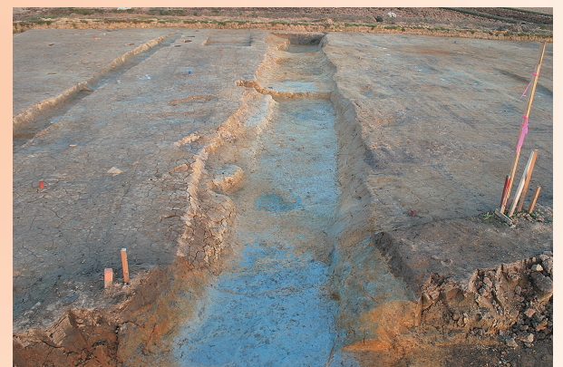
区画のために掘られた溝(西から) 調査区を東西に横断する溝で幅約2.5メートル、深さ約1メートルあります。底には段差がありました。