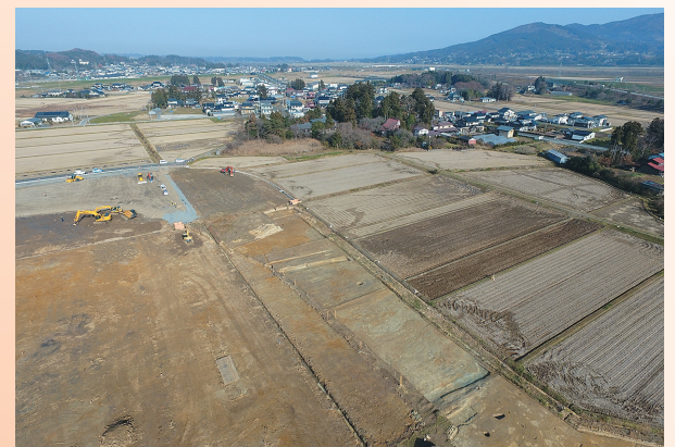
上空(南)から見た調査区全景と八坂神社