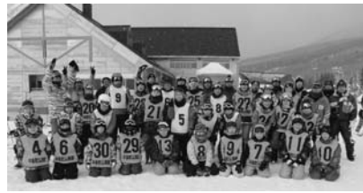
岩手高原スノーパーク

1月6日、13日、20日の3日間岩手高原スノーパークで教室を開催しました。参加登録した40人の児童は平泉スノードルフィンの皆さんの指導で、見る見るうちに上達していききました。