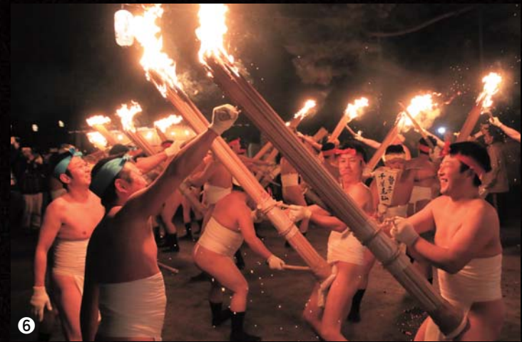
① 燃え盛るたいまつを荒々しくぶつけ合い火の粉を散らす／② 常行堂を目指す献膳行列一行／③⑤ 凛々しい表情の厄年男衆／④ 二十日夜祭の角灯／⑥ 境内には下帯姿の厄年男衆らの勇ましい掛け声が響いた