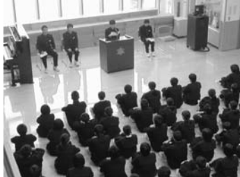
始業式での決意発表の様子

さて、本校では、毎週水曜日の業間休みに全校で体力作りの運動をしています。1、2学期はシャツランをしてきました。校庭が使えない冬場は、体力増進、跳躍力・持久力の育成のため全校縄跳びを行います。