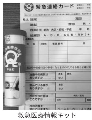
救急医療情報キット