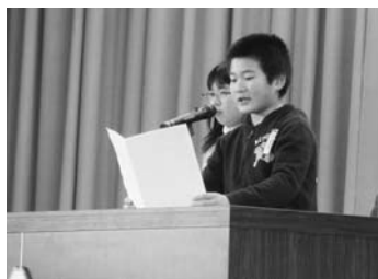
6年生の代表児童による発表

り、その後果報団子の由来などを聞きながら、試食しました。4区子供会では、伝統行事「きんこならし」の体験学習を行いました。9区子供会では、餅つきやお雑煮作り、会食を通して地域の人と交流する活動を行いました。10区子供会では今年も祇園地区の伝承芸能である祇園獅子舞を練習し、祇園地区小正月行事で発表しました。全ての地区を紹介できないことが残念ですが、学校では学ぶことのできないたくさんの方を地域の方から学ぶことができた地域学習でした。