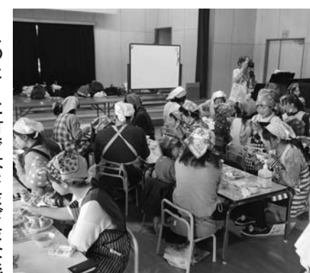
平泉保育所での親子クッキングの様子

■親子クッキング 各幼児施設を会場に親子での調理実習を行います。調理を通して親子のコミュニケーションを図りながら、食事のマナーや、バランスの良い食べ方について学びます。