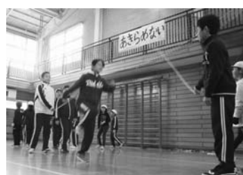
力を合わせて長縄とびの練習

2月20日(火)は、本年度最後の地域授業参観日です。午後1時35分からの授業公開を予定しております。ぜひ、お気軽に足をお運びください。なお車でお越しの際は、町営毛越寺駐車場をご利用ください。