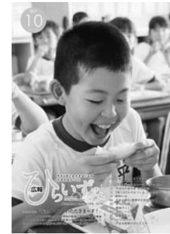
◀広報紙の部2位《平成29年10月号》 特集「黄金メロン—5つの『み』カー—」

1月17日に平成29年度県市町村広報コンクール審査会(県広報協議会など主催)が開かれ、広報ひらいずみ10月号が広報紙の部(参加26点)で2位に入賞し、県代表として全国広報コンクールに初めて出品されることになりました。また、組み写真の部(参加41点)では、2月号14~15頁の毛越寺常行堂「二十日夜祭」の組み写真が2位となり、初めて入賞しました。広報コンクールは、地方自治体の広報活動の向上を目的に毎年開催されており、広報紙の部では企画力、文章力、デザイン・レイアウト技術などが審査されます。10月号では、町特産品の「黄金メロン」を特集。生産現場に6カ月間密着し、現状や今後の課題などを徹底取材しました。受賞は、取材に協力してくれる皆さんや読者の皆さんのおかげです。これからも「広報ひらいずみ」をよろしく願います。