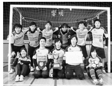
優勝したKFCのメンバー

大会結果は次の通りです。 ▽優勝 KFC ▽準優勝 FCすぐる会 ▽第3位 FC火猿