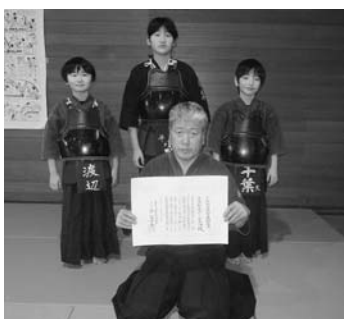
受賞した平泉剣道スポーツ少年団

平成29年12月、平泉のスポーツ少年団活動に対しての長年の功績を称え、全日本剣道連盟より少年剣道教育奨励賞を平泉剣道スポーツ少年団が受賞しました。