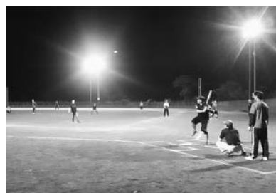
11区が優勝した壮年ソフトボール大会

本年度のオリンピック競技は、全日程を終え、年間総合成績は11区が545点で優勝を飾りました。11区は8月の壮年ソフトボール大会で優勝すると、その後も着実に得点を積み重ね、他行政区の追撃も許さないといい展開でした。