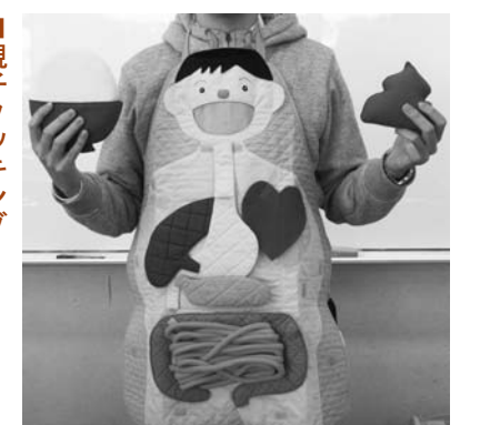
エプロンシアターで使う教材

④自分で料理できる力 五感を使って実施する料理は子どもたちの創造力や集中力を育て、自信にもつながります。まずは家庭の手伝いから始めてみましょう。親子と一緒に料理をすることでコミュニケーションがとれ、食について考える機会にもなります。