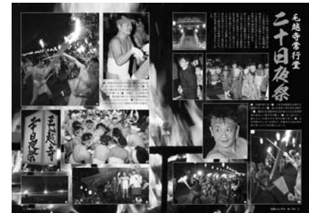
◀組み写真の部2位 《平成29年2月号》 毛越寺常行堂 「二十日夜祭」