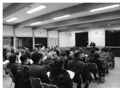
稲を束に似る山(東稲大学にて)