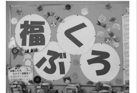
好評だった福袋貸し出し