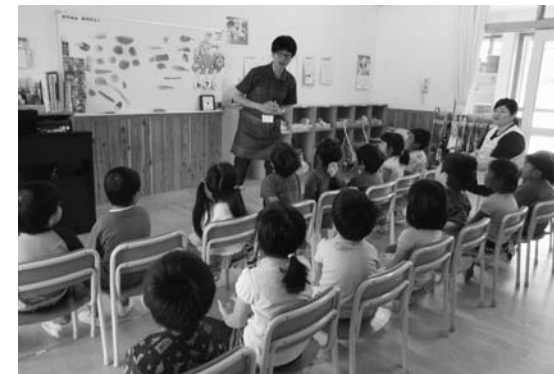
長島保育所での食育教室の様子