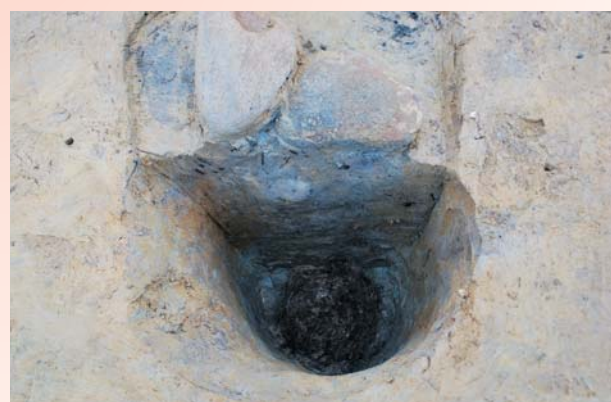
柱根が残っていた柱穴