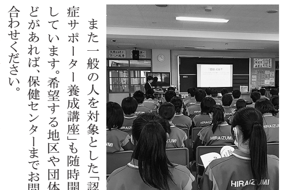
認知症について学ぶ平泉中の生徒