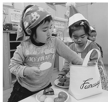
ままごとに夢中の子どもたち