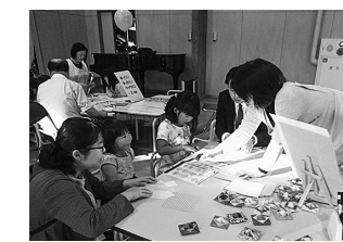
制作に夢中になる子どもたち

「あなたの暮らしに町立図書館」を合言葉に掲げて、町民の皆さまに図書館を身近に感じてもらえる取り組みを今後も実施していきます。ご支援をよろしくお願いいたします。