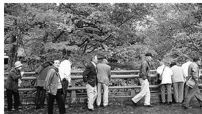
紅葉の見頃を迎えた碧祥寺(東夷大学)