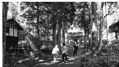
西和賀町の碧祥寺を訪問(東稲大学)