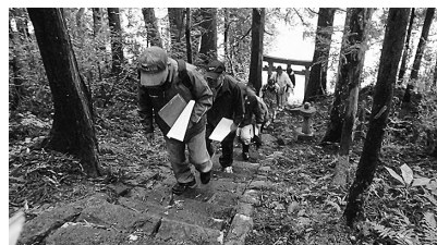
町内の各地域に伝わる遺跡を巡る