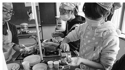
おいしい水ギョーザができるかな?