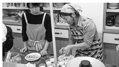
プリンとパンキンパイ作りに挑戦