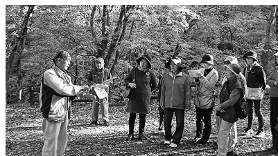
紅葉を見るため奥州市衣川へ