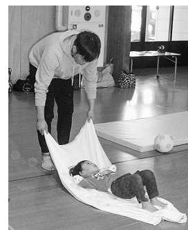
バスタオルを使った遊び

■バスタオル滑り 子どもが乗ったバスタオルを滑らせて、乗り物のようにして遊びます。