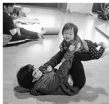
楽しい遊びが盛りだくさん

子育て支援センターでは、親子の触れ合いや、五感を使った遊びを紹介します。どうぞ、お気軽にお越しください。