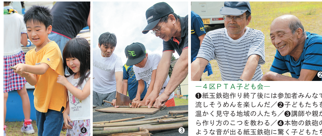
—4区PTA子ども会— ①紙玉鉄砲作り終了後は参加者みんなで流しそうめんを楽しんだ／②子どもたちを温かく見守る地域の人たち／③講師や親から作り方のコツを教わる／④本物の鉄砲のような音が出る紙玉鉄砲に驚く子どもたち

4区ふれあいセンターで7月29日、4区PTA子ども会が主催する地域学習「紙玉鉄砲作り」が行われました。紙玉鉄砲とは紙の玉を空気圧で飛ばすおもちゃのこと。材料は竹と新聞紙など身近にあるものだけを使う昔ながらのおもちゃです。 学習には小学生とその保護者、地域住民ら約20人が参加。児童らは慣れない手つきながらも、大人の手ほどきを受けて、上手に竹を切り、紙玉鉄砲を完成させました。参加した児童は「作るのは大変だったけど、自分で作ったおもちゃで遊ぶのは楽しい」と満足そうな笑顔を見せていました。また昼食には流しそうめんが振る舞われ、児童たち