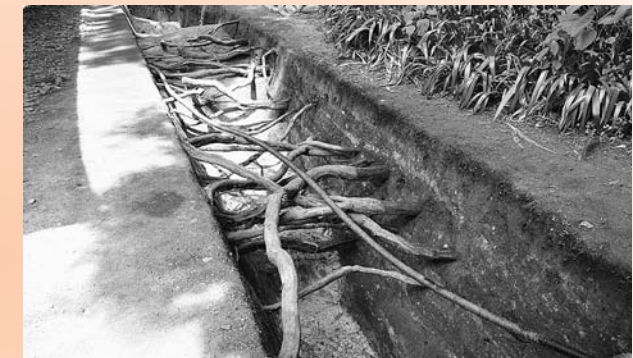
【写真2】大きな溝が地面の下から見つかりました(東から) 周りの杉が枯れないように根を残しながら掘りました。写真奥の根から手前に向かって下がっている溝の断面が見えます。

「いつ」は、12世紀の整地層の下から見つかっていることから、12世紀以前。「なぜ」は、区画や排水などが考えられますが、小まめにメンテナンスが行われていることから、重要な溝であった可能性があります。関所との関わりを含めて、12世紀以前の中尊寺周辺を考える上で貴重な発見です。