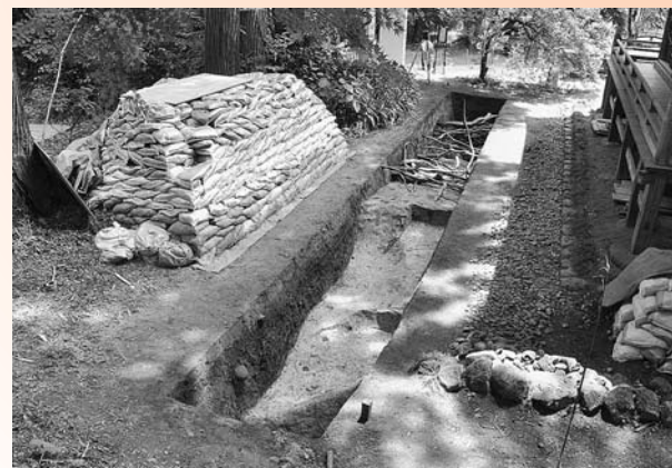
【写真1】釈迦堂の脇を細長く調査しました(西から)