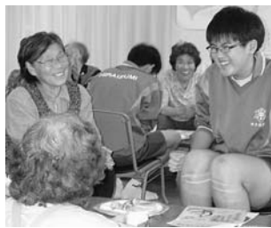
町役場での職場体験

6年生は、エプロン作りの様子を見ていただきました。おばあさんたちのおかげで作業がとてはかどりました。本当にありがとうございました。たくさんのお返事をいただき、感謝申し上げます。