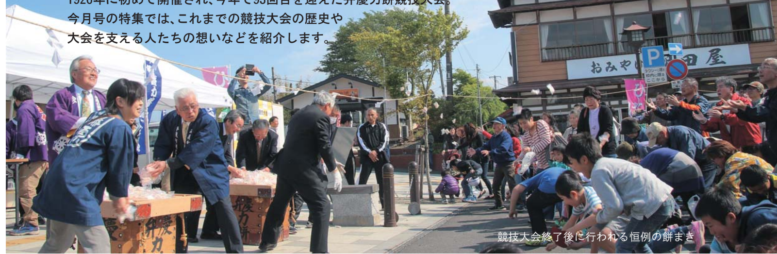
競技大会終了後に行われる恒例の餅まき

1926年に初めて開催され、今年で93回目を迎えた弁慶力餅競技大会。今月号の特集では、これまでの競技大会の歴史や大会を支える人たちの想いなどを紹介します。