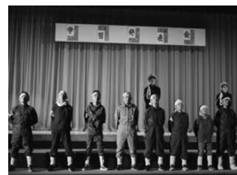
学習発表会 6学年劇「ほたるの青い空」

10月21日、学習発表会が行われました。「練習してきた成果を出し切り、観ている人に笑顔と感動をとどけよう」をスローガンに取り組んだ今年の学習発表会。合唱や合奏、不朽の名作劇、創作劇など、各学年の特徴を生かして児童一人一人が主役の発表会でした。きつと観