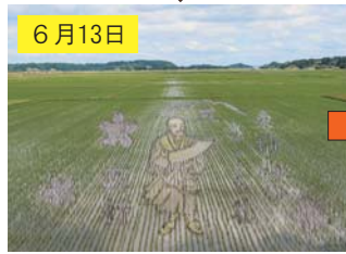
6月13日 稲の丈が伸びて徐々に色づきを増し、図柄部分の輪郭が出てきた