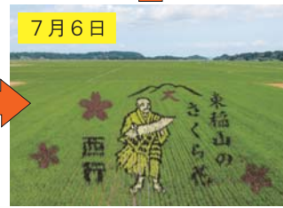
7月6日 見頃を迎え、訪れた人や通行人が高館橋からの眺めを楽しんでいた