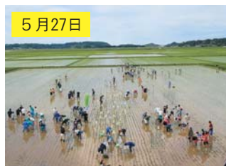
5月27日 田植えには約200人が参加し、図柄部分を4色の有色稲の苗に植え替えた