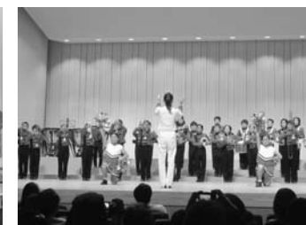
一関地方吹奏楽祭

れまでお世話になった方々に心を込めて感謝のメッセージを届けることができました。 11月12日の長島小学校統合40周年記念式典およびふれあいコンサート開催に向けて、実行委員会を中心に取組が進んでいます。