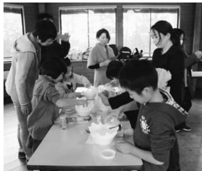
バターできたかな？

10月7日、12組28人の親子で小岩井農場まきば園に行ってきました。雨の中ではありませんでしたがバター作り体験やアトラクションなど親子で楽しむことができました。