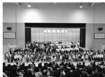
学習発表会フィナーレ 全校合唱