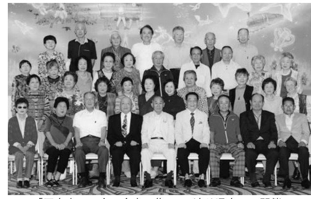
「平泉中二八会 傘寿の集い」 渡り温泉にて開催

この年齢になると腰が痛い、膝が痛い、体の調子が悪いと言いがちになる。参加人数も気が掛かるところだが、予