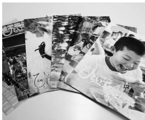
「広報ひらいずみ」は毎月2,960部発行している