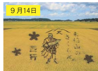
9月14日 稲が金色に色づき、見頃の時期とは違う景色が楽しめる