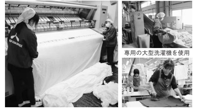
専用の大型洗濯機を使用 徹底した衛生管理下で作業している クリーニング事業も展開

私たちの仕事はシーツや枕カバー、布団カバー、タオル類など直接肌に触れるものを扱うことが多いので、破損品などがないように気を付けるだけでなく、預かったとき以上に清潔な状態でお届けすることを心掛けています。高齢化社会となり、病院や介護・福祉施設でのリネンサプライ事業の需要が増加することが予想されます。従業員が一丸となって成長すること、またお客さまの満足と信頼に応えることを胸に秘め、さらに邁進していきたいと思えます。