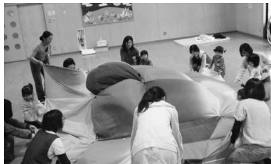
みんなの広場10月ふろしき遊びの様子

ふろしきがないときには、シーツや大判のハンカチでもできます。ぜひ家庭にあるもので遊んでみてください。