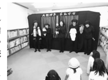
「どんぐり」の皆さん

9月16日、人形劇グループ「どんぐり」の本年度の初公演が行われました。「どんぐり」は1986年に結成され、一関地区の図書館関連の団体としては、一番歴史の長い読み聞かせグループです。