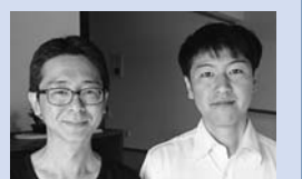
菊池代表(左)と葛西副代表