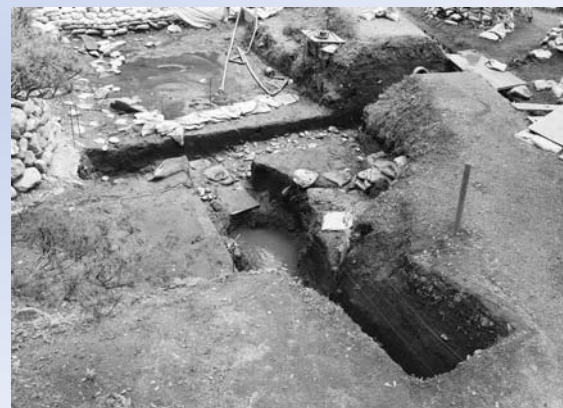
蝦蟇が池と調査トレンチ(北西から)

前産磁器1点が出土しました。近世以前の蝦蟇が池は、現在の池岸より西側に広がりをもっていた可能性があります。