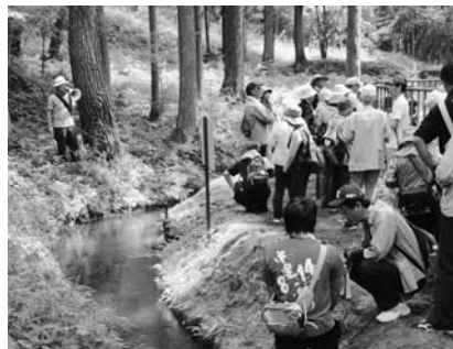
地域の水資源に理解を深める参加者

照井土地改良区などが主催するウォーキング。今年で第7回目を数え、照井堰用水や平泉の歴史を勉強しながら、約10kmのウォーキングが楽しめるとして町内外から多くの人が参加します。