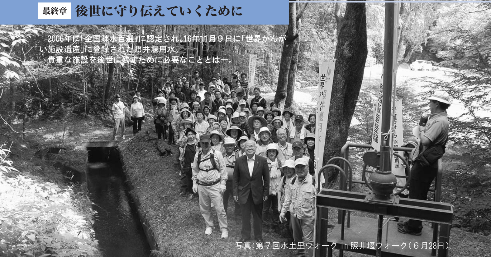
写真：第7回水土里ウォーク in 照井堰ウォーク(6月28日)

2006年に「全国疎水百選」に認定され、16年11月9日に「世界かんがい施設遺産」に登録された照井堰用水。貴重な施設を後世に残すために必要なこととは—。