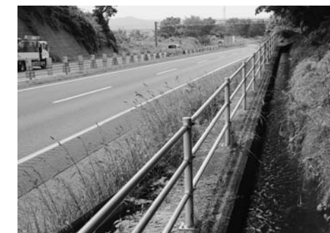
高速道路沿いを流れる照井堰用水

照井堰用水は全部で8路線あり、総延長は64kmにも及びます。町内を歩いていると、さまざまな場所で流れている水を見ることができます。