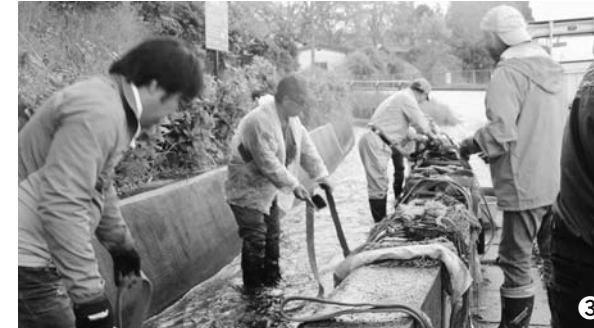
①_照井堰から毛越寺庭園への取り入れ口/②_庭園に注ぐ「遣水」/③_現在も洗い場として活用される照井堰用水

水田へのかんがい用水を引くために開削された照井堰用水は、田畑の作物に水を供給するだけでなく、飲用や雑排水はもろろんのこと、防火用水、消雪用水、大雨時の治水、水辺の植物や水生生物の生活環境など、多様な領域に関わっています。また地域の景観を豊かにする親水空間を提供するなど、一関・平泉の各集落の地域環境を形成する核にもなっています。