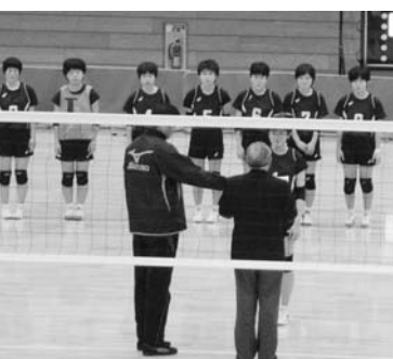
県大会での活躍が期待されます