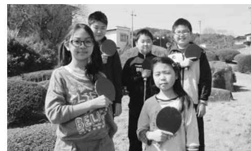
団員を募集しています(平泉卓球スポ少)

本年度新たにスポ少を立ち上げる予定がある場合は、4月5日(水)までに町スポーツ少年団事務局(役場教育委員会内 ☎46-5576)までご連絡をお願いします。