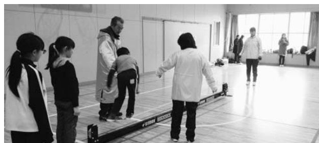
スラックラインに挑戦中

ンタグララグビーの各種目を体験しました。このうちドッジボール(スポンジ状のフリスビー)を使ったドッジボールでは、ゲーム中みんなだとも楽しそうにプレーする姿が見られました。