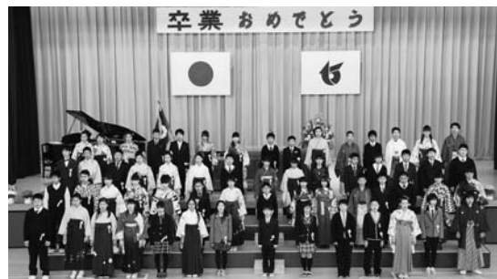
心のコもった別れの言葉

3月17日、卒業証書授与式が行われました。60人の卒業生たちは、6年間の思いを胸に堂々と式に臨みました。「夢と希望を抱き、新しい一歩を踏み出します」別れの言葉は、感謝と決意に満ちあふれた感動的なものとなりました。合唱「大切なもの」旅立ちの日にでは、6年間の集大成にふさわしい自信と希望に満ちた美しい歌声が式場に響きました。自分の課題と目