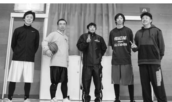
優勝を果たした11区のメンバー

町内行政区対抗バスケットボール大会(町バスケットボール協会主催)が3月5日、平泉中学校体育館で開催されました。 3行政区から約30人が参加し、毎試合白熱とした戦いとなりました。 大会には8区、11区、16区が参加。強豪ぞろいの中、11区が息の合ったプレーで見事優勝を勝ち取りました。 大会結果は次のとおりです。 ▽優勝 11区 ▽準優勝 8区 ▽第3位 16区