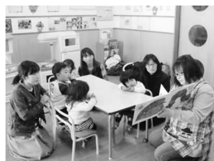
絵本の読み聞かせの様子

新年度のスタートです。環境が変わることの多いこの時期、新しい環境に対して子どもたちは期待と喜びでドキドキ、ワクワクすることでしょう。しかしその一方、環境が変わることに對して不安が顔をのぞかせるかもしれません。子どもたちがいざだちや落ち着きのない行動をとっても、新しい生活に慣れるまで、ぜひ子どもたちの成長を温かく見守ってあげてください。 子育て支援センターでは、本年度も楽しい活動を計画しています。子育て支援センターでのみならず、のびのびクラブ、給食試食会だけでなく、その他にも町内各所で子育て支援事業が開催されます。