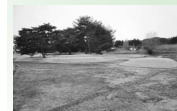
復元された北小島と中島(北東から)

今回発掘調査の成果に基づき当時の形に復元・盛土し、表面に芝を張りました。平等院よりも1.5倍ほど大きい無量光院跡の北小島は、これまで地面の下に眠っていましたが、今回の整備で大きさや他の島との位置関係が視覚的に分かるようになりました。