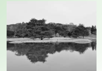
昨年度の水張りの様子(東から)

張ったばかりの芝が根付くまで、島への立ち入りは禁止となっていますが、復元された北小島と併せてぜひご覧ください。なお、島への立ち入り公開は、お盆期間中に期間限定で予定していますので、今しばらくお待ちください。