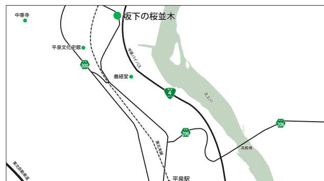
【坂下の桜並木】 平泉町平泉字坂下地内

県道三日町瀬原線の桜並木と比較すると短く感じますが、1885年に植えたといわれるエドヒガンは大きく育ち迫力満点です。