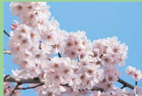
桜とのすてきな出会いがありますように