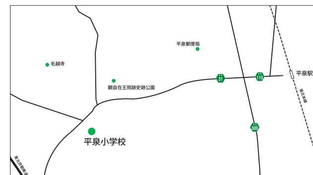
【平泉小学校】 平泉町平泉字倉町155 ☎46-2202