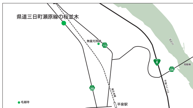
【県道三日町瀬原線の桜並木】 平泉町平泉字花立地内

県道三日町瀬原線(旧国道4号)の道路沿いに植えられたソメイヨシノの桜並木は約400mも続き、満開の時期には桜のトンネルを抜けるような爽快な気分になります。「平泉の桜」と言ったらこの場所を思い出す人も多いのではないのでしょうか。