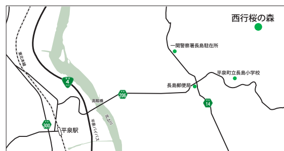
【西行桜の森】 平泉町長島字深山95-741 ☎46-5420

西行桜の森がある一帯は、奥州藤原氏初代清衡の祖父に当たる安倍頼時が1万本の桜を植えたとも伝えられており、かつては「さくら山」として知られる一山が薄桃色に霞んで見えるほど桜が咲き誇っていたとされています。平安時代後期の有名な歌人・僧侶である西行法師は、そのあまりに美しい桜の景色を見て「ききもせず東稲山のさくら花よし野のほかにかかるべしとは」と詠んだと言われており、この古歌を通じて、平泉には奈良の吉野山に引けを取らないほどの美しい桜の名所があると知られるようになりました。