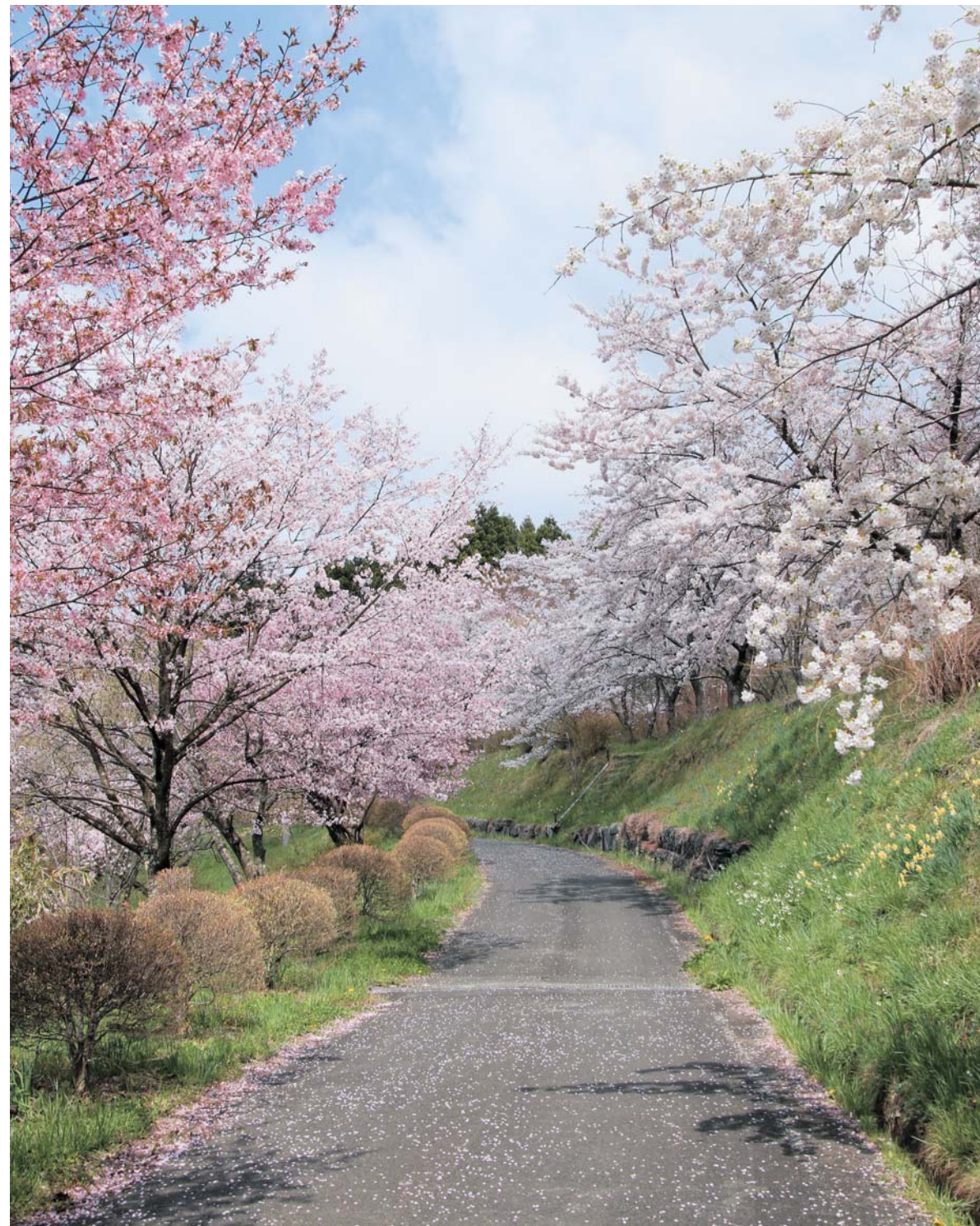
西行桜の森にはさまざまな種類の桜が広範囲に植えられている。そのため高低差や樹種の違いにより、一斉に開花することはない、長期間桜を楽しむことができる(2016年4月20日撮影)