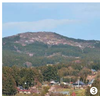
①_桜だけでなく、西行桜の森では眼下に広がる壮大な景色も楽しむことができる/②_かつてのさくら山をイメージしたCG画像。駒形峰から東稲山へ連なる山域は、吉野山に肩を並べる桜花の名所として有名だった/③_高館から見た現在のさくら山の様子。往時の桜情景の復活が期待されている