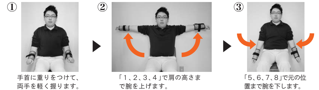
① 手首に重りをつけて、両手を軽く握ります。