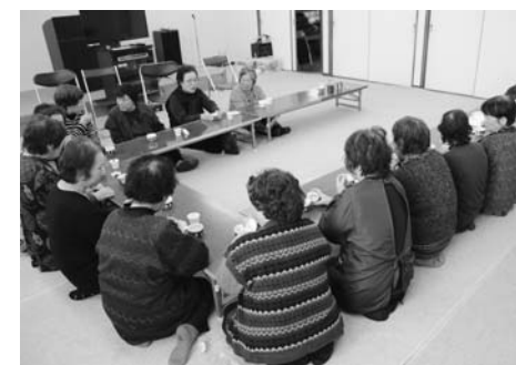
体操後の楽しいお茶会(21区の皆さん)

地域の皆さんで「平泉いきいき百歳体操」を始めよう！ これから先、増え続ける高齢者の生活支援に対して、介護保険サービスのみだけでなく、地域住民のつながりが重要となってきます。そして介護予防では高齢者の運動機能や栄養状態などの改善を目指すだけでなく、生きがいや自己実現を図れる環境づくりも大切となります。 現在町内では、平泉いきいき百歳体操を通じて地域のつながりや新たな交流が生まれ、活動の活性化が図られています。 いつまでも健康で生き生きと生活できる健康長寿を目指し、地域の皆さんで「平泉いきいき百歳体操」を始めませんか。 【第2特集】目指せ！健康長寿—平泉いきいき百歳体操を始めよう—