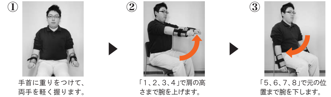
① 手首に重りをつけて、両手を軽く握ります。