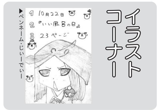
イラスト コーナー

「みんなの広場」は、町民の皆さんのページです。町の話や町への要望など、掲載を希望される人は、はがきでご連絡ください。