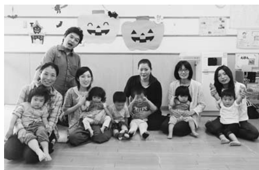
みんなでおもちゃ作ったよ!

初めて参加された保護者から「在園の子どもたちがあいさつしてくれたり、遊んでいる様子が見れていいですね」との意見がありました。子育て支援の活動に参加しながら、保育所や幼