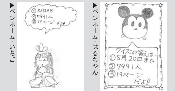
ペンネーム・いちこ