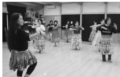
昨年の教室の様子