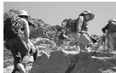
平成27年度「早池峰登山」