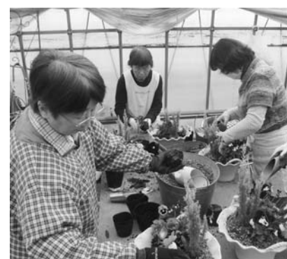
寄せ植え講習会の様子