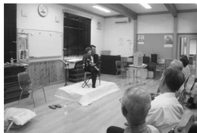
昨年第2回に開催した講演