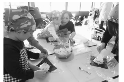
平泉幼稚園の親子クッキング(2月19日)

うにと食生活の改善に取り組んでいます。その一つとして、保育所や幼稚園などで「親子クッキング」「チャレンジクッキング」「毎月の食育指導」、小学校においては「健康や生活習慣病予防教室」を実施しています。