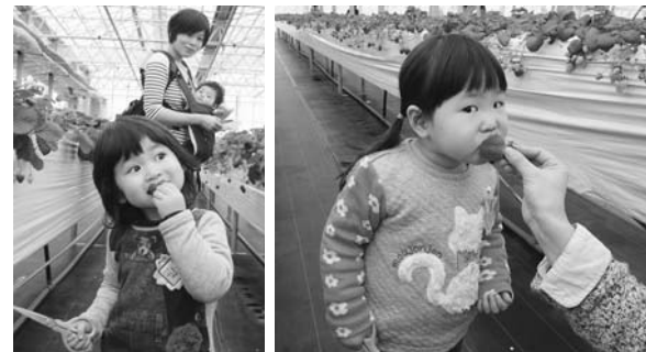
いちごおいしいね!

のびのびクラブの2月の活動は「いちご狩り」を開催しました。今回の活動では親子でいちごを食べるだけでなく、普段スパーでしか目にすることがないいちごが、どんな風に育っているのか、目の前で実っている果実を実際に見て、触って、味わって香りを嗅いで、身近に春を感じる大切な体験となりました。子どもたちはいちごを食べながら「おいしい」と普段よりも大きな声で、嬉しそうにお母さんに伝えていました。それを聞いたお母さんたちも「おいしいね」とお子さんに伝えていた様子がたくさん見られました。子育ての中でも、日常にお子さんと一緒に楽しみながら出来る体験を取り入れ、楽しい、嬉し