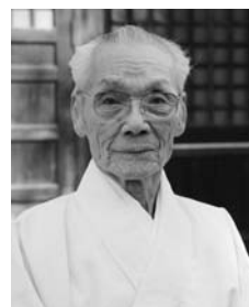
「地域で守ろう」 その心づかいがありがたい