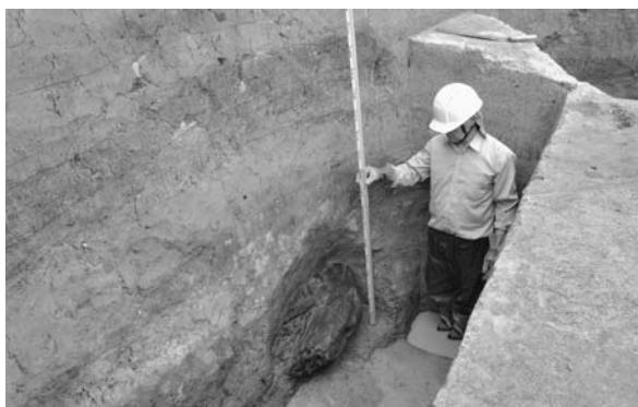
白山社遺跡から出土した丸太