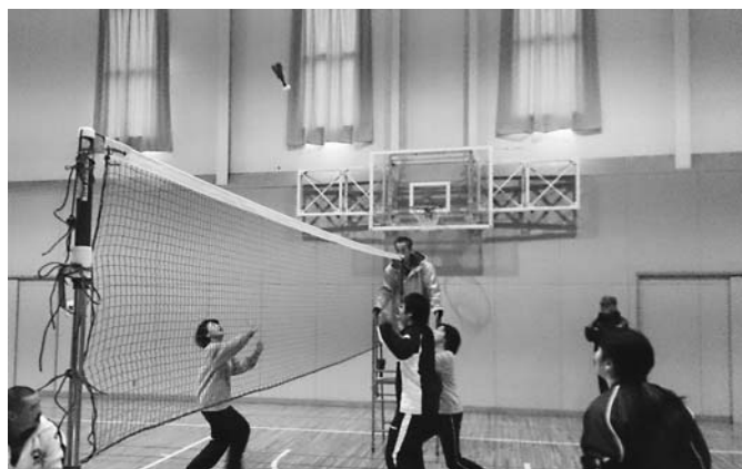
羽根のついたボールをバレーボールのように打ち合うインディアカ

費用：無料 申し込み方法：希望のメニューを選び、開催希望日の3週間前までに教育委員会へお申し込みください。