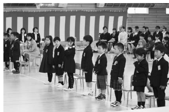
緊張した面持ちの新1年生

本校では、4月6日に紹介式・始業式、7日に入学式が行われました。新入生16人を迎え、全校児童86人、教職員22人で27年度がスタートしました。