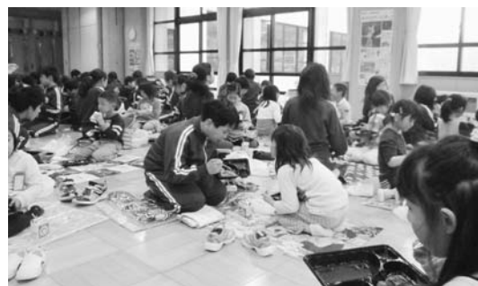
仲良くお弁当(桜給食)を食べる1年生と6年生

4月7日、桜の開花とともに全校児童294人での27年度がスタートしました。入学式の会場には、41人の元気な返事が響き渡りました。入学式後に行われた2年生の楽しい学校紹介やダンスに、興味津々で見入る1年生。これから始まる学校生活のわくわく感が伝わってきました。