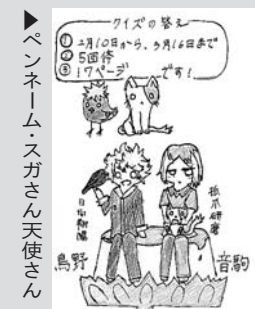
ペンネーム: スガさん 天使さん