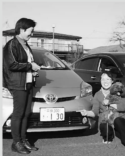
ナンバー交換をした愛車を前に(写真上)/愛車に平泉ナンバーを取り付けるドライバー(写真下)