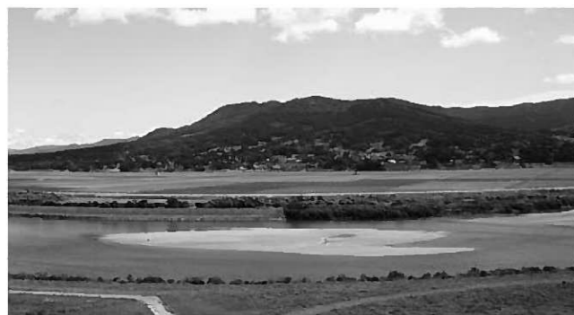
追加指定されることになった「さくら山」

▽さくら山：平泉町長島字山田51番地452ほか4筆 19万3160平方メートル 平泉町所有地