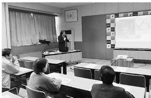
熱心に聞く参加者