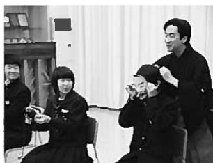
能面を身につける生徒