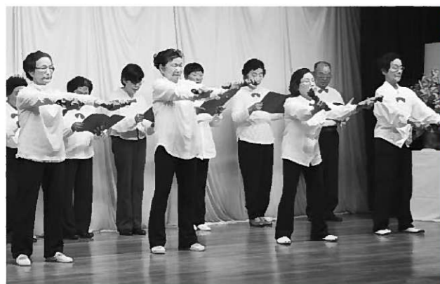
12区脳いきいきさわやかクラブによる発表

認知症になるかならないかは、一人一人の脳の使い方次第。生き生きと自分らしく生きることが認知症の予防につながると話していました。