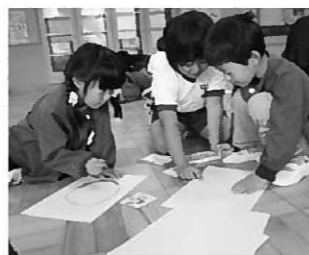
幼小交流会からた作り

11月14日5校時、1年生から6年生までが一緒にオリジナルゲームに挑戦する児童会主催「縦割り班集会」が行われ、校内は一大イベント会場と化しました。30チームに分かれて、紙飛行機飛ばしや豆移しなどのゲームに挑戦。体育館では、チームごとに思い思いに遊び、元気も笑顔もいっぱいの子もたちでした。