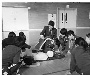
救命救急法を学んだ6年生

6年生は、救命救急法を学びました。初めての経験に最初は戸惑いを見せましたが、実技を繰り返すうちに命の大切さを学び、真剣さが増す子どもたちでした。