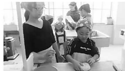
ピザ生地をこねている様子

11月15日(土)、町公民館実習室で12組の親子がピザ作りに挑戦しました。 生地をこねたり、ピーマンやベーコン等の具材をトッピングしたりと、どの親子も協力し合いながら楽しんで作業をしていました。焼きあがったピザは、とても美味しかったようで、みんな大満足でした。 次回は、県南青少年の家でクリスマスキャンドルを作ります。