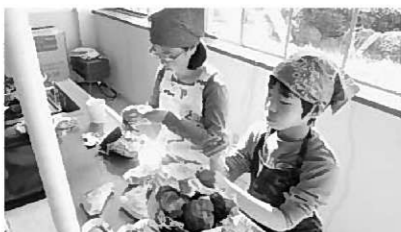
優雅にティータイム♪

今回の活動は、第1回目に植えたサツマイモを使って、焼き芋、アップルパイ、スイートポテトを作りました。 参加した塾生14人は、サツマイモの皮をむくのに大苦戦していたようですが、自分たちの力で一生懸命頑張りました。 完成したスイーツは試食用とおみやげ用に分けて、試食用は紅茶と一緒にいただきました。 次回はいよいよ最終回。金ケ崎町のみどりの郷でスケートに挑戦します。