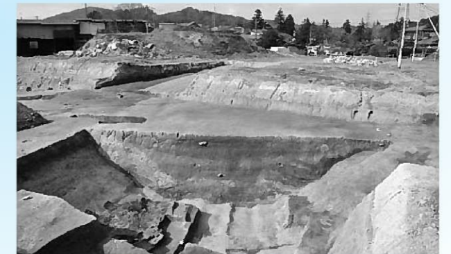
内側の堀跡の断面

墓も築かれていたと考えられます。また、伽羅之御所跡側で土塁状の施設が存在したことは、柳之御所遺跡の正面性を考える上でも重要な成果となります。