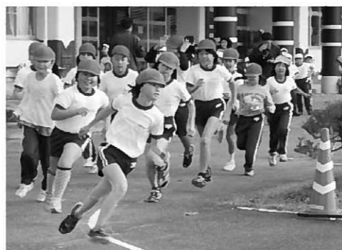
学校を飛び出しロードへ

11月は、PTA親子ふれあいコンサート、校内ロードレース大会と多くの行事で子どもを伸ばしました。