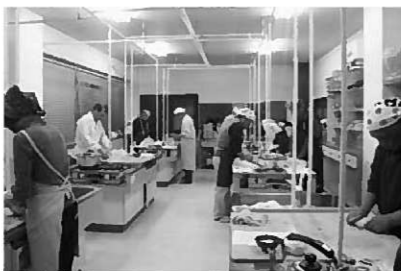
麺づくりの心得を習得しました

11月20日(木)、第3回目の今回は、手打ちラーメン作りに10人が挑戦しました。 中華麺に欠かせない“かん水”を使い、本格的なラーメンを作りました。ラーメンは他の麺よりも寝かせる時間が重要とのことで、「こねる」「寝かせる」の作業に1時間ほどかかりました。 最後にネギや焼豚、メンマなど、いろいろな具材をトッピングして、一から手作りの麺を堪能しました。