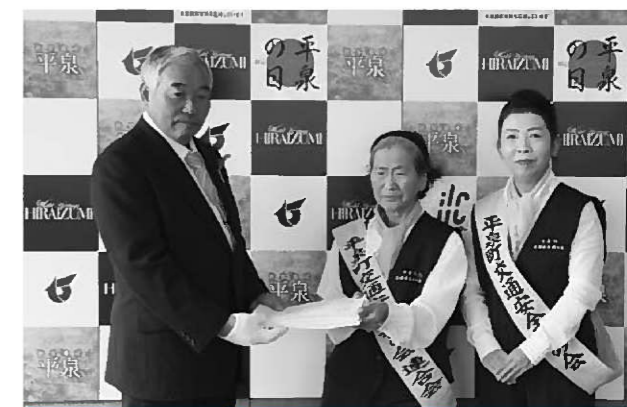
署名簿を提出する千葉会長(中央)ら