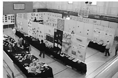
本年度も多くの力作が並びました

11月1日、2日の2日間にあわせて「第27回公民館まつり」を開催しました。出展者数は366人、出展数612点と数多くの作品提供がありました。 出展者の皆さまには、準備から後片付けまでご支援とご協力を頂き、誠にありがとうございました。 来年度も皆さまの積極的な参加をお待ちしています。