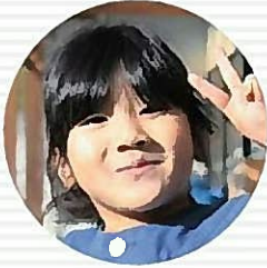
プリキュア おおもり あきね 大森空音ちゃん