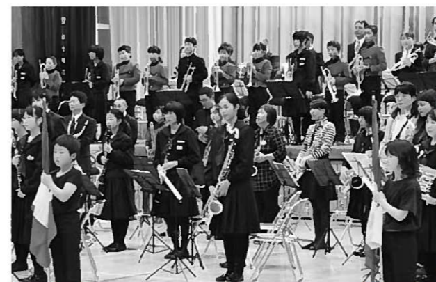
参加者全員で迫力ある演奏を披露しました

コンサートの最後は、長島小合奏団、長島オールスターズ、ゲストの皆さんによる合同演奏。今年は平泉中吹奏楽部も参加し厚みを増したサウンドを会場いっぱいに響かせました。