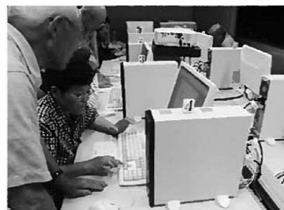
指導を受けている様子

これからも多種多様なパソコン教室を開催しますので、興味のある人はお気軽にご参加ください。