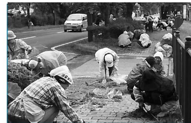
商工会女性部員らたくさんの女性が参加しました