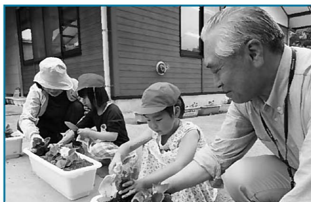
人権擁護委員と花を植えるきらり園園児

当日は小雨の降るあいにくの天気でしたが、指揮者の指示の下、日ごろの訓練の成果を披露しました。