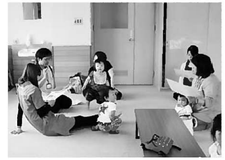
のびのび広場の様子

また歯の衛生週間ということで、町保健センターの保健師から「おやつについて」話があり、虫歯になりにくいおやつの選び方を学びました。参加者から質問もあり、虫歯予防の意識向上を図りました。