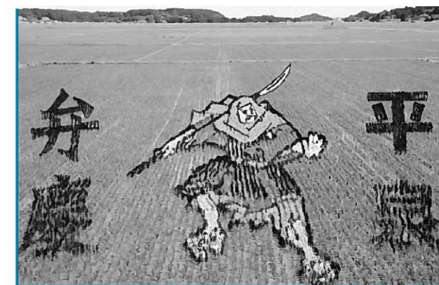
ほ場に浮かびあがる武蔵坊弁慶(6月23日撮影)