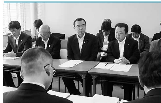
町の現状を訴える

これまで、東京電力は国の原子力損害賠償紛争審査会の中間指針に示された内容のみ賠償対象とし、限定的な部分でしか認めていません。現在、県と関係市町村などとともに原子力紛争解決センター(ADR)和解仲介あっせんを申し立てており、今後も引き続き交渉をしていくこととしています。