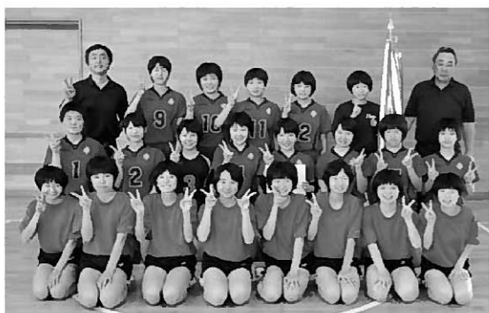
見事優勝を果たしたバレー部