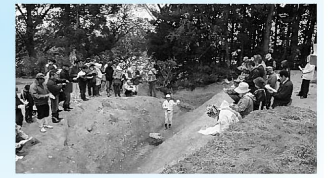
館岡Ⅱ遺跡の堀跡(現地公開)

のことを指しているようですが、今回の発掘の成果から館岡Ⅱ遺跡も含めた一つの大きな戦国時代の城館と考えたほうが良いようです。城館の範囲(縄張)は南北約400m、東西約200mと想定されます。