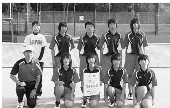
個人での活躍も光ったソフトテニス部