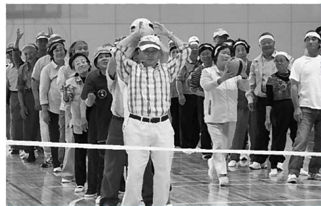
元気いっぱいプレーしました