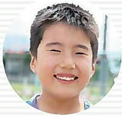
スーパーマリオ スんとうゆうが 遠藤悠河くん