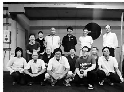
インターゴルフガーデンで記念撮影

参加者の皆さんは、「とても勉強になった」「ゴルフをするのが楽しくなってきた」「また教室をやってほしい」など、大満足の様子でした。