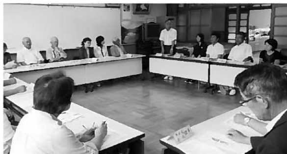
長島小区教振運営委員会の様子

6月15日、八雲神社の例大祭が行われ、本校合奏団が「地域に元気を伝えよう・地域とのつながりを高めよう」というテーマとともに東日本大震災の早期復興の願いを込め参加しました。