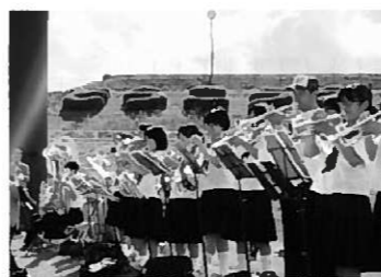
声援を送る特設応援隊

第9回一関地方中学校総合体育大会が6月14日～16日に行われました。平中生は各種目で熱戦を繰り広げ、成果と感動をつくりました。コーチとしてご指導をいただいたり、練習施設を使わせて下さったりと、各部を支えて応援して下さいました。保護者や地域の皆さまに感謝いたします。中総体では吹奏楽部と美術部が応援隊を結成して声援を送りました。1日目は花泉球場で野球部の応援。吹奏楽部のコンバットマーチに合わせて大きな声援を送りました。応援隊の願いが叶わず、藤沢中に敗れてしまいました。がスタンドからは野球部員の健闘に大きな拍手が送られました。2日目は東山総合グラウンドでサッカー部を応援。附属中との決勝戦では、野球部員も合流し特設応援隊を組んで大きな