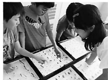
あいぽーとでの施設見学の様子