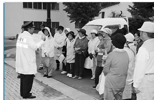
熱心に耳を傾ける会員の皆さん

平泉駐在所署員が交通ルールの確認と高齢者に被害の多い特殊詐欺被害の防止方法について説明。その後、平泉を訪れる人にきれいな町を歩いてもらいたいと区内の道路清掃を行いました。