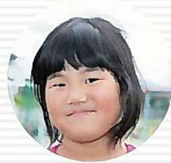
ハピネスチャージプリキュア おおともれな 大友怜那ちゃん