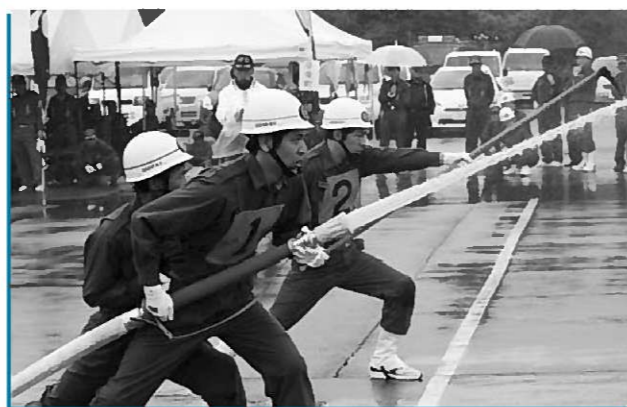
小型ポンプの部に出場した第2分団の隊員