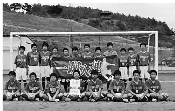
第2位の成績を収めた平中サッカー部