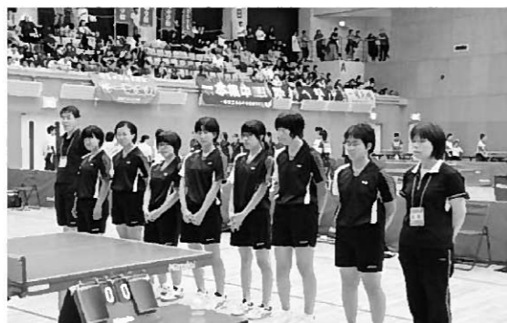
第3位の成績を収めた女子卓球部