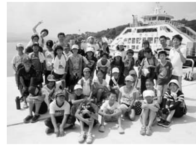
たくさん思い出できました!