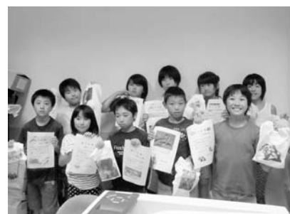
お気に入りのオリジナルグッズ完成♪

参加した11人は、パソコンの基礎を学びながら、お気に入りのキャラクターやペイントソフトで作った絵などを使って、オリジナルTシャツとオリジナルうちわを作りました。完成した作品をみて、みんな大満足だったようです。