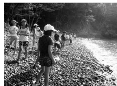
トレッキングコースの途中にある若木浜での1枚

8月1~2日、宮城県気仙沼市大島でキャンプを実施してきました。29人の塾生が参加し、トレッキングコース散策や野外炊飯、レクリエーションに海水浴など、たくさん遊んで、たくさん学んだ2日間でした。