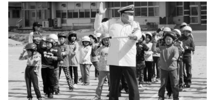
交通指導員から自転車の手信号を学ぶ児童

本校では、4月7日に紹介式・始業式、8日に入学式が行われました。新入生14人を迎え、全校児童81人、教職員21人で平成26年度がスタートしました。 9日には、一斉下校指導を実施。長島地区は、見通しの悪いカーブや坂道が多くなり、自転車乗りや歩行には危険がいっぱい。担当の先生からは危険箇所や危険について「自分で考え判断し、命を守る」ことができると話がありました。その後、担当の職員と一緒に、高学年が先頭になり下校しました。