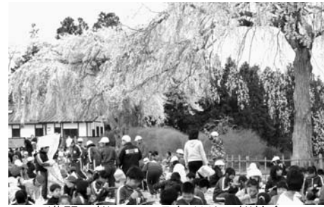
満開の桜の下で5年ぶりの桜給食

46人の新入生を迎え、全校児童306人で平成26年度が始まりました。4月7日、全員出席で迎えた始業式。わくわくどきどきしながらの担任発表、新しい教科書を手にした子どもたちの笑顔あふれる1日でした。 8日の入学式では、2年生が元気いっぱい演技と演奏で1年生の入学を祝福しました。2年生の見事な発表に1年生は興味津々、新入生も元気に学校生活をスタートしています。