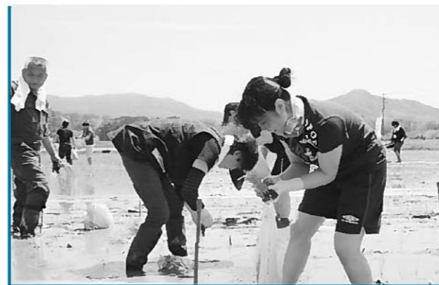
晴天の下、ほ場に苗を植える参加者たち。間もなく見ごろを迎えます。