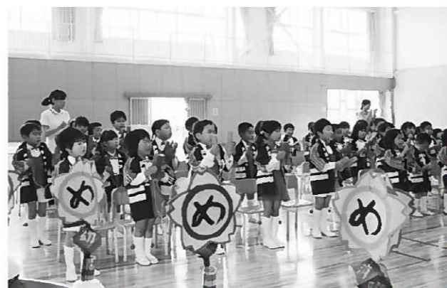
拍子木を打ちながら「火の用心の歌」を歌う園児

16日の本祭では、総勢100人による献饌行列や獅子舞などが行われ、地域を挙げたお祭りが盛大に開催されました。