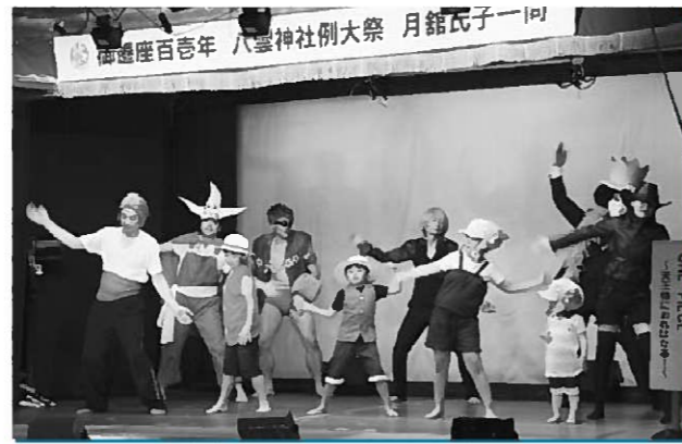
多彩な演目が披露された前夜祭