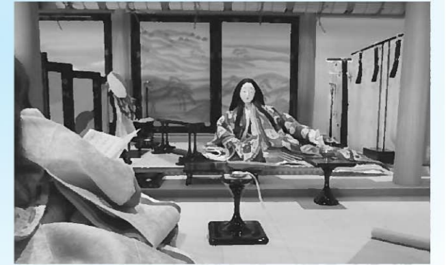
4分の1サイズの寝殿造模型

期間…7月28日(日)まで 9:00~16:30 場所…平泉文化遺産センター ホール 問い合わせ先…観光商工課 ☎46-5572