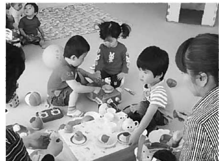
室内で遊ぶ子どもたち。みんな仲良く遊びました。

6月4日の「のびのび広場」は、志羅山児童館を会場に開催しました。7組子ども11人が参加し、外で滑り台やブランコなどをして遊んだり、室内でままごとや乗り物などのおもちゃを使って遊びました。外でシャボン玉遊びをすると、青空にふわふわと虹色のシャボン玉が舞い上がり、シャボン玉初体験のお友だちは「すーい」と歓声を上げて喜んでいました。また歯の衛生週間にちなんで、保健センターから虫歯になりにくいおやつを選び方などについてお話を聞いて虫歯予防の意識向上を図りました。 今月は町保健センターで、トイレトレーニング(1回目)を行います。