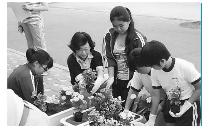
人権擁護委員とともに花を植える長島小の児童

その間、産業建設常任委員長などを歴任し、地方自治の発展と住民自治の向上に尽力、貢献されました。