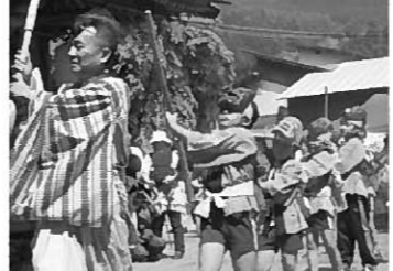
合奏を元気にする長島小祭りを盛り上げました(上)演奏団/低学年もお祭り(下)