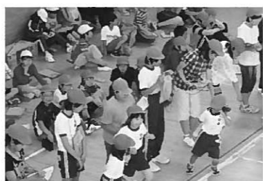
1年生に声援を送る6年生

一つ目は、学習旅行で行った平泉のPR活動です。仙台市の繁華街で、道行く人に声をかけ、平泉の見所をまとめたお手製のパンフレットを配りました。パンフレットを手にとった方々は「上手にまとめているね」「がんばっているね。ご苦労さま」と声を掛けてくださいました。大きな仕事をやり遂げた後の表情は、皆充実感に満ちあふれていました。