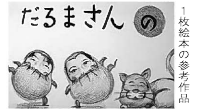
1枚絵本の参考作品

夏休みの宿題やわが家のオリジナル作品として楽しんではいかかですか? 参考作品は図書館に掲示してありますので、興味のある方はぜひご来館ください。詳しい内容は図書館へお問い合わせください。