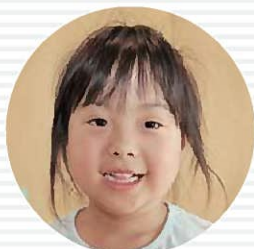
どきどきプリキュア あらい かの 荒井香乃ちゃん