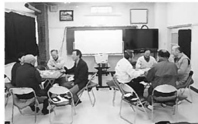
町民講座「健康マージャン教室」