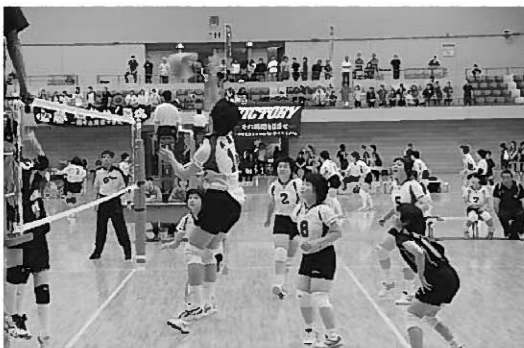
力強くアタックするバレーボール部

また個人戦でもソフトテニス、バドミントン女子シングルス、柔道で入賞を果たしました。