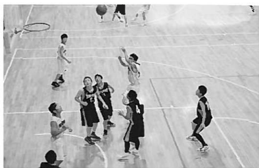
勝利を目指しシュートを放つバスケットボール部

バスケットボール部は1回戦で東山中に勝利。2回戦では大東中と対戦し、前半にリードを奪われましたが、後半に逆転し70-67の3点差で接戦を制しました。準決勝は山目中に67-