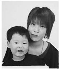
鈴木 悠流 すずき ゆうりゅう 「夜仕上げ磨きをし、その後キシリトールタブレットを与えています」