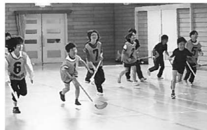
元気いっぱいに楽しみました