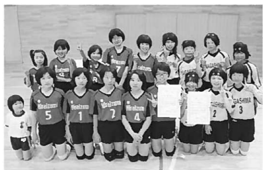
平泉・長島両バレースポ少のメンバー

両チームは、6月22日に花巻市で開催された同県大会に出場しました。平泉・長島両チームとも健闘及ばず惜しくも予選リーグ敗退となりましたが、今後の活躍が期待されます。