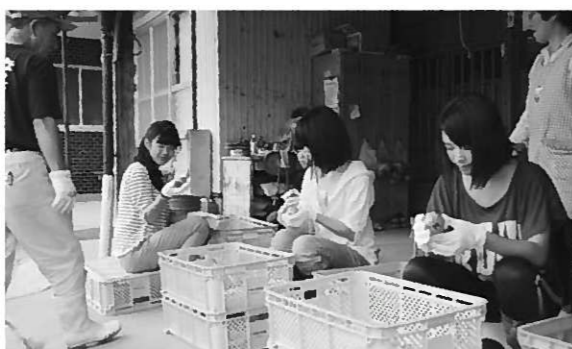
昨年の江東区立深川第六中学校の受け入れの様子