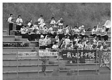
熱い応援をした特設応援隊

中総体では特設応援隊を組織。1日目は東山球場で野球部を応援、吹奏楽部のコンパットマーチの演奏に合わせ、美術部