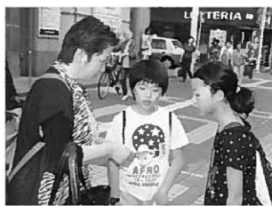
平泉をしっかりとPRしてききました

二つ目は、スポーツテストです。低学年は、毎回数を数えたり、「がんばって」と励ましの声を掛けたりと、頼もしいお兄さんお姉さんぶりを発揮してくれました。さまざまな活動を通して着実に成長し自信を深めている6年生は、平小のリーダーとしてさらに力強く学校を引っ張っていくことでしょう。