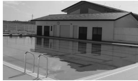
▶平泉中学校に整備されたプール