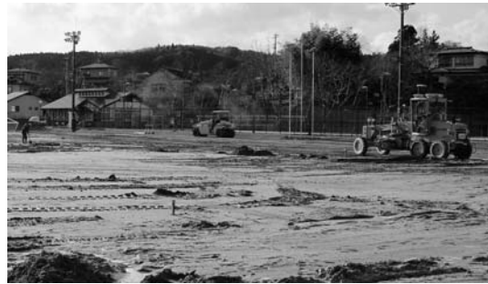
▲放射線低減対策工事(写真は平泉中グラウンド)