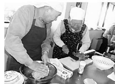
調理実習で家事力アップ (写真上)／世代間交流の様子(写真右)

介護予防教室では、▽足腰を中心とした運動機能を維持・改善すること▽嚙んだり飲み込んだりする機能を維持・改善すること▽低栄養を予防すること▽を介護予防のポイントとして取り組んでいます。これらのポイントに加え「参加者自身が楽しみを持って取り組