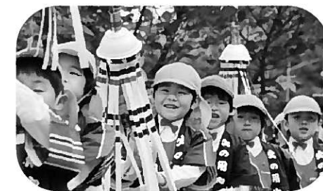
幼年消防クラブの活動