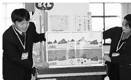
お父さんの読み聞かせは迫力満点！

昨年大好評だったお父さんによる読み聞かせに、今年は何と7人ものお父さんがデビューを果たしました。お母さん図書ボランティアによる事前の厳しい特訓を経て、この日を迎えたお父さんたち。初めてとは思えないほど感情豊かで、かつ迫力ある演技を交えての読み聞かせを披露しました。子どもたちは、あつという間に本の世界に引き込まれていました。ふだんあまり本を読まない子どもには、とても新鮮な体験だったようで、改