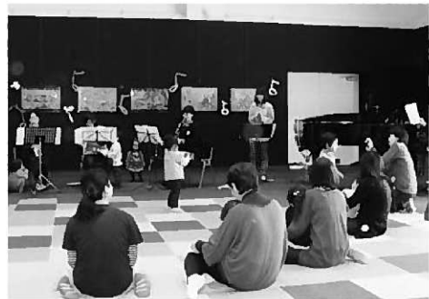
楽しい時間を過ごしたミニコンサート

今月の「のびのびクラブ」は18日(火)、長島公民館で「クリスマス会」を開催します。皆さんぜひご参加ください。