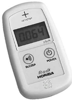
◀貸し出し用の放射線測定器

町では、放射性物質の拡散や町内の放射線量への理解と不安解消を目的に本年2月から放射線量測定器の貸し出しを行っています。今回、より身近に宅地周りなどの測定を行えるよう各行政区に測定器を1台ずつ貸し出します。 測定器の管理は各行政区長にお願いしています。測定器の使用を希望する人は、各行政区長に申し出てください。