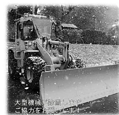
大型機械が除雪します。ご協力をお願いします

▽除雪の障害となりますので路上駐車はしないでください。 ▽作業中の除雪車との車間距離を十分に取って通行してください。