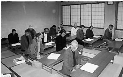
昨年度の教室の様子