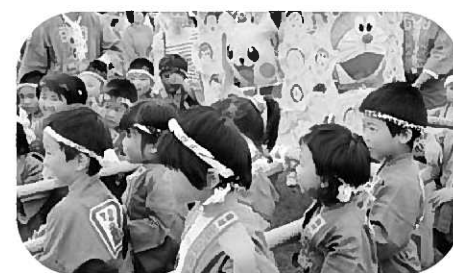
幼稚園園児による水かけ神輿