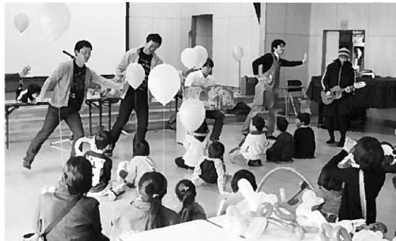
パパさんたちの読み聞かせに踊りが加わり、子どもたちも興味津々

また平泉小学校体育館の一角では、古くなった除籍本を町民の皆さんに無料で配布するコーナーを設置。500冊用意した本もわずかしかなかった。大盛況に終わりました。