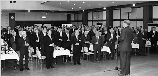
平成24年新年交賀会の様子