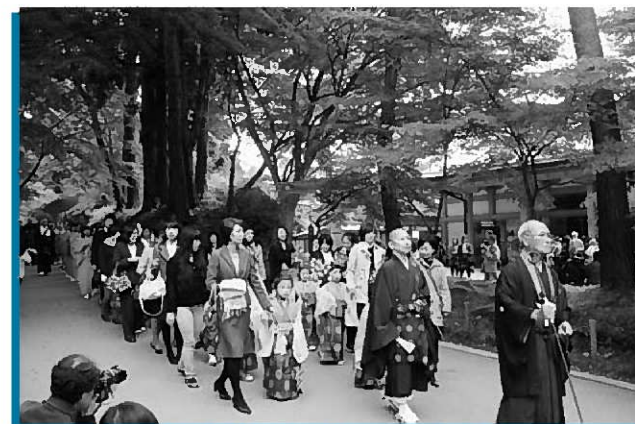
参道を練り歩く稚児行列の参加者

このうち中尊寺で行われた恒例の稚児行列では3～6歳の幼児18人が参加。華やかな衣装に身を包んだ幼児は保護者らと手をつなぎ、周りの木々が色付きはじめた本堂から金色堂までの参道をゆっくりと練り歩きました。華やかで愛らしい光景に、観光客らは足を止めカメラを向けていました。