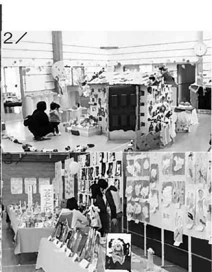
1/文化祭では園児による元気な謡で幕を開けた 2/おとぎの世界のように飾られた園舎のホール 3/児童生徒の作品も多数展示された 4/大人気だったサイエンスショー 5/力作が勢揃い