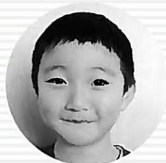
ゴーカイジャー こいけ ゆいちろう 小岩雄一郎くん