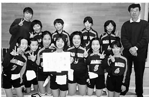
準優勝を果たした長島バレースポ少

第28回信ちゃんカップ一関地方小学生バレーボール大会（一関市バレーボール協会など主催）が11月3日に一関市内で開催され、長島バレースポ少が準優勝の快挙を成し遂げました。