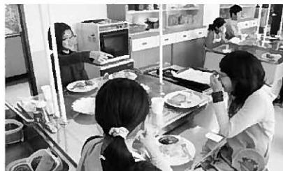
美味しくできました