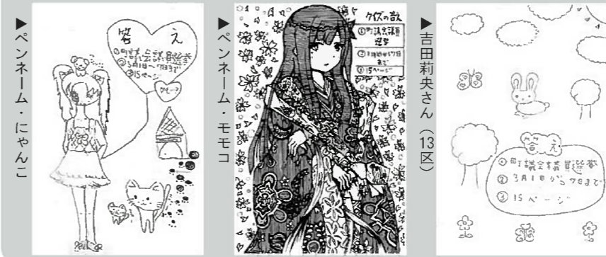
▶ペンネーム・にゃんこ