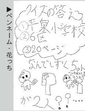
▲ペンネーム・花つち