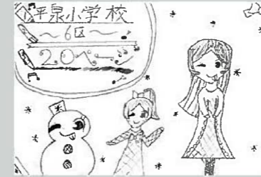
▲ペンネーム・しのっぴ