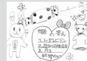
▲ペンネーム・チア