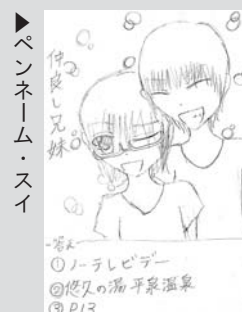
▶ペンネーム・スイ