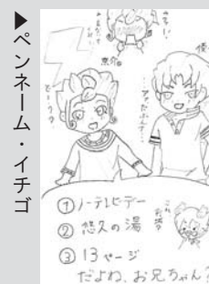
▶ペンネーム・イチゴ