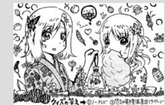
▲ペンネーム・モモコ