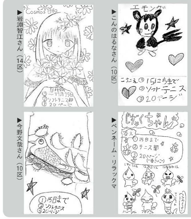
イラスト コーナー