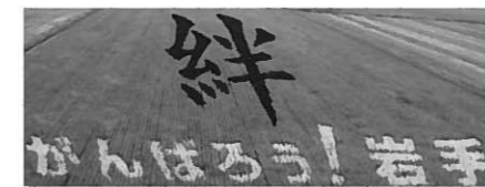
高館橋東側のほ場に「くっきりと浮かび上がる「絆 がんばろう! 岩手!」の文字

日 時…10月22日(土) 10:00~ 場 所…高館橋長島側の水田 参加費…無料 持ち物…手袋、長靴、稲刈り鎌 問い合わせ先 (農) アグリ平泉 ☎46-5231