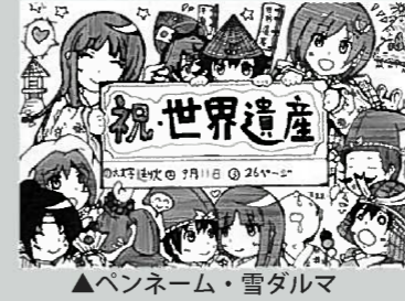
▲ペンネーム・雪ダルマ