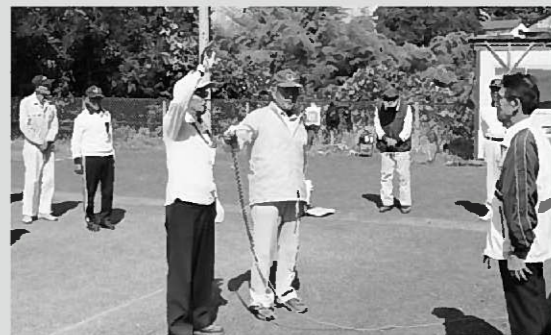
優勝を目指し選手宣誓する5区選手代表