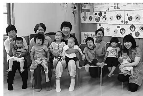
にっこり笑ってハイチーズ!

来月は、のびのびクラブと合同で「ブルーあそび」をします。詳しくは、子育て支援センターへお問い合わせください。