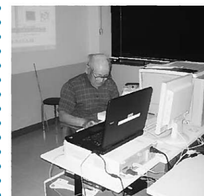
慣れない手つきでパソコンに挑戦

町公民館主催「シニアパソコン教室」が、6月2日から、毎週木曜日の計6回講座で開催されました。対象者が60歳以上の初心者の方という点もあり、みんな慣れない手つきで悪戦苦闘。基礎からの講座でしたが、講師のパソコン同好会・富