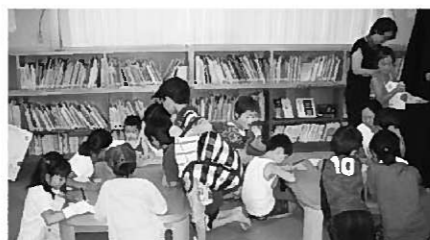
盛りだくさんのおはなし会

紙付手紙コーナーなど、盛りだくさんの充実した1時間となりました。親子連れ、おばあちゃんとお孫さんなどが、読み聞かせの後、家族へお手紙を書き、折り紙でペンギンを折りました。「働いているお父さんへ」など、家族を思った手紙にいろいろな親子ペンギンが貼り付けられると、職員もほのぼのとした手紙に感動しつつ、大事そうに持ち帰る姿を見送りました。