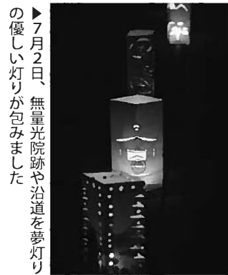
▶7月2日、無量光院跡や沿道を夢灯りの優しい灯りが包みみました

今回の祈願参拝は、世界遺産登録のために応援いただいた皆さんへの感謝と、東日本大震災で犠牲となられた方々のご冥福とお祈りし、東北復興を皆さまとともに祈願するため開催しました。参拝は、多くの方々のご賛同とご協力により無事終了することができました。平泉の文化遺産を後世に守り伝えていくことが私たちの使命であり今後も感謝と復興への思いを忘れず、継続してイベントを開催し地域を盛り上げていきたいと思います。