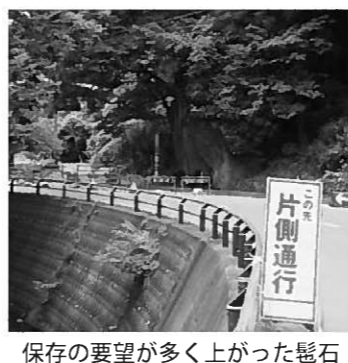
保存の要望が多く上がった髭石