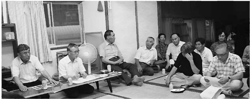
多くの意見が交わされた5区懇談会