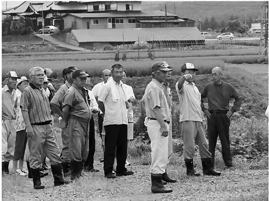
9区懇談会では懇談会に先立ち現地を確認した