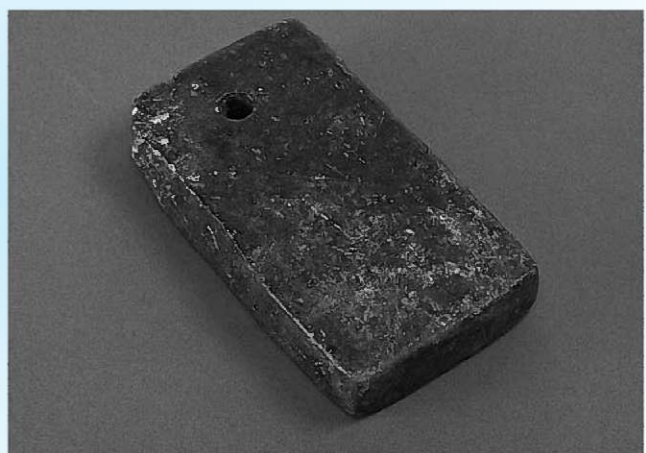
志羅山遺跡から出土した温石