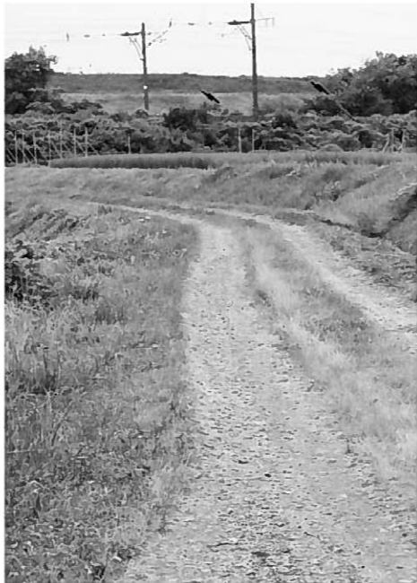
利用量が多くなり改修が望まれる町道三貫線