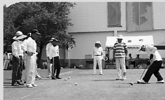
熱戦が繰り広げられたゲートボール競技