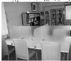
新しく設置された衝立付きの机

ました。また7月からは、「衝立のある机」を設置し、より落ち着いた読書のできる環境にステップアップしました。どうぞご利用ください。