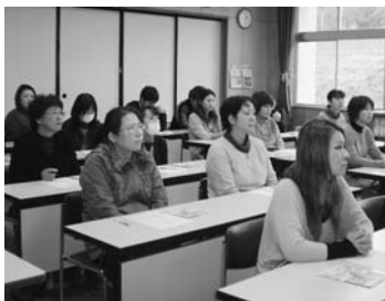
熱心に話を聞く保護者

を大きく変えることになったというお話をされた「自分の力」ということをお話の中で何度も繰り返されました。また11月18日には、楽器