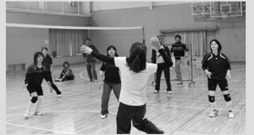
熱戦が繰り広げられた決勝戦

大会では、優勝を目指すだけでなく和気あいあい、伸び伸びとしたプレーが随所で見られました。