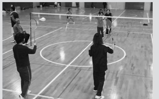
白熱したバドミントン大会

町バドミントン協会主催の行政区対抗バドミントン大会が10月30日、平泉中体育館で開催されました。