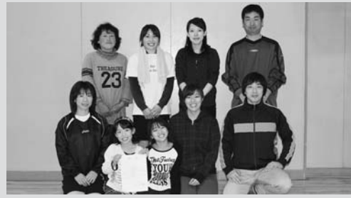
抜群のチームワークで優勝を果たした6区

「ふるさとオリリンピア2011」インディアアカ大会が11月6日、町立長島体育館で開催されました。インディアカは、羽根のついた特殊なボールを手で打ち合うバレーボールタイプのスポーツ。同競技の普及を図るため、レディス限定とした今大会には、7行政区区約50人が参加しました。