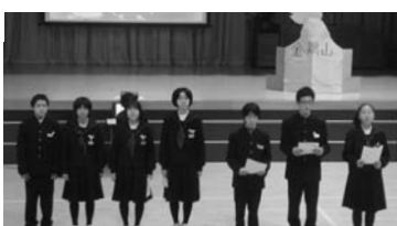
取り組みを発表する生徒たち

が大きかったようで「とても分かりやすかったです。教えてもらった金鶏山をバックに夕日に映える無量光院跡をぜひ見に来たい」との感想