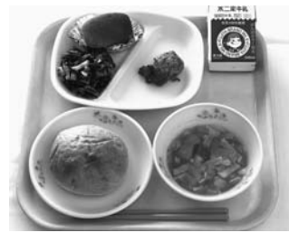
給食甲子園のメニュー(右上から牛乳、いわいどりのじゅうね味噌焼き、大文字りんご、ひじきのごまサラダ、きんいろ丸パン、ごりやく麺の和風ミネストローネ)