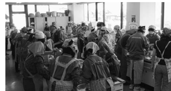
中学生を対象にしたカルシウムアップ教室

妊娠中、おなかの赤ちゃんが健康に育ち、お母さんも体調良く出産できるように、母子手帳交付の際に栄養指導を実施しています。