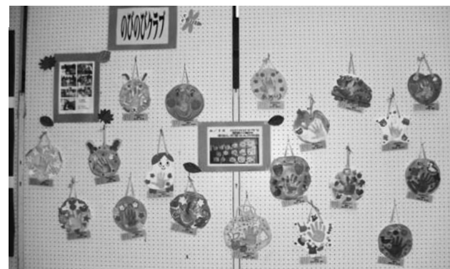
◀かわいらしい作品が展示されました

「こころの健康」に関する相談窓口が保健センターにあります。「眠れない」「何となくこころが晴れない」など悩み事がありましたら保健センターにご相談ください。