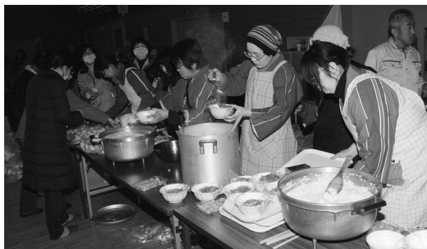
▶ 婦人消防協力隊による炊き出し

また福島第1原子力発電所が地震・津波の被害を受け、農作物や水道など放射能物質による汚染が心配されるなど国民の生活に大きな影響が出ています。