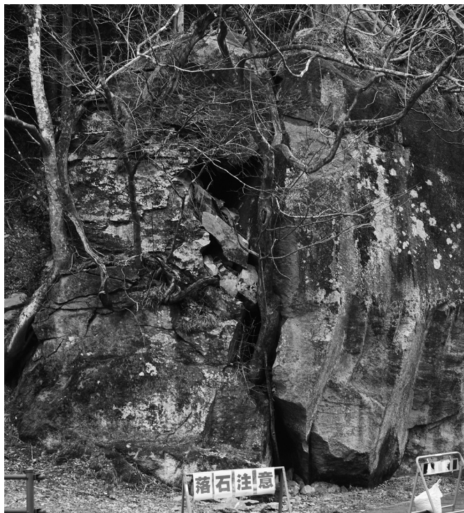
今回の大地震により、大きな亀裂が生じた髻石（5区）

3月11日午後2時46分、東北地方を中心とした広い地域で大きな地震がありました。震源は宮城県三陸沖でマグニチュードは観測史上世界4番目となる9.0を記録。宮城県栗原市で震度7、当町では震度5強を観測しました。 また地震直後に発生した大津波により、岩手県をはじめ、宮城県や福島県など広範囲の沿岸地域に甚大な被害をもたらしました。