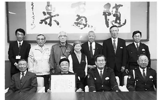
死亡事故ゼロ継続へ決意を新たにしている関係者

今野署長は「今回の達成は、地域の地道な活動の成果であり、1年間は通過点として3年、4年と継続してほしい」と期待を寄せた。町長は今後さらに関係機関と一体となって、交通安全の推進に努めることを誓いました。