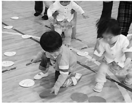
ゲームを楽しむ子どもたち