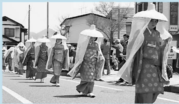
▲あでやかな藤原家侍女の一行