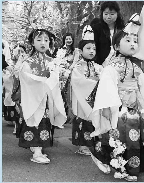
▲まつりの開幕に華を添えた稚児行列