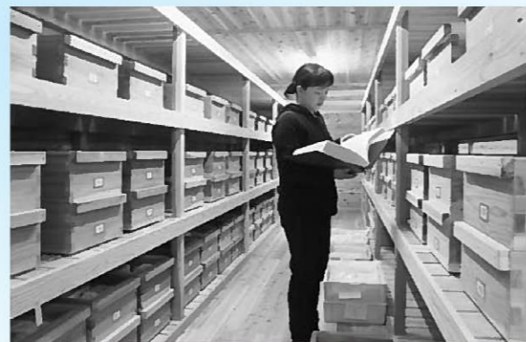
新たに設置された木製収蔵室の室内

にご覧いただくこととなります。今後は分かりやすいパンフレットを作成し、ホームページでの公開、学術資料としての目録作成や調査研究などで活用を図っていくこととなります。