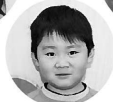
クレープ屋さん はぐれいわたる 北嶺航