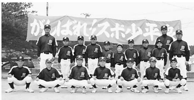
▶郡予選を制したスポ少平泉

試合結果は次のとおりです。 【準決勝】平泉5―1油島 涌老4―0花泉 【決勝】平泉8―5涌老 優勝したスポ少平泉は、6月に岩泉町で開催される同交流大会の県大会に出場します。