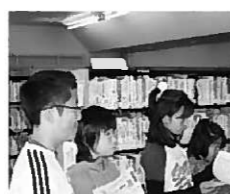
体験学習の参加者

委嘱状を受け取った4人は、図書館についての説明を聞いた後、カウンター業務・本の配架・パソコンによる本の検索の仕事を体験しました。パソコンでラベルのことや作者や数がひと目で分かったのが驚きでした。分類をみて、その本があった場所に正確に戻すのが難しかった。