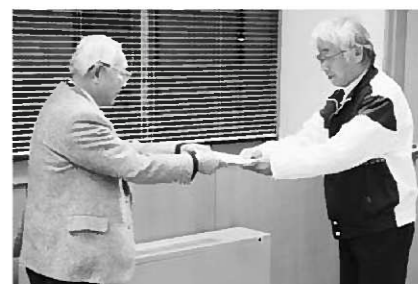
南館教育長から委嘱状を受け取る体育指導委員