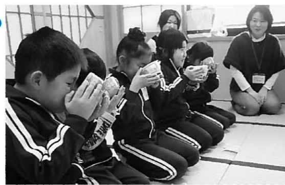
お抹茶をいただく子どもたち