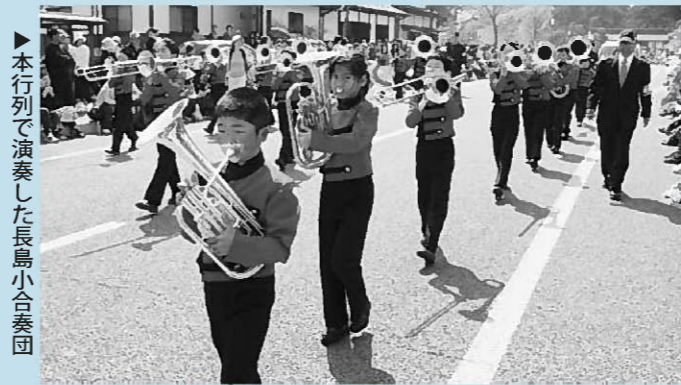
▶本行で演奏した長島小合奏団