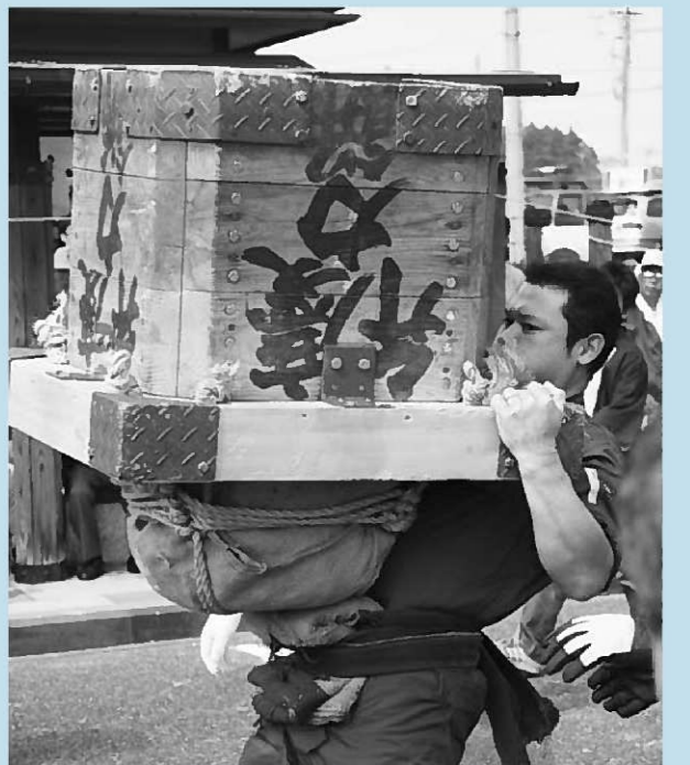
▲21人が力自慢を競った弁慶力餅競技大会