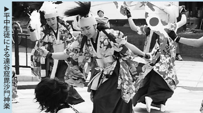
▶平中生徒による達谷窟毘沙門神楽