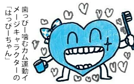
歯っぴー噛むカム運動イメージキャラクターの「はっぴーちゃん」