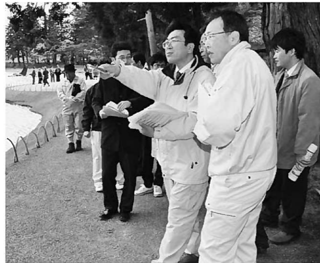
毛越寺庭園での現地確認作業。イコモスの現地調査では、庭園の整備手法や保存管理の現状について、分かりやすい説明が求められます

の日程は決定していませんが、現段階で考えられるさまざまな状況を踏まえた対応が求められていることから、今回の確認作業の結果も参考にしつつ、今後の具体的な対応について協議を進めていくこととなります。