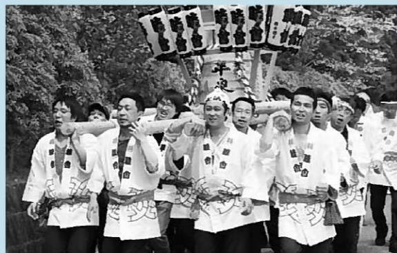
▲威勢良く神輿を担ぐ13区睦会