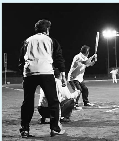
前回のオリンピックの様子

町民参加型スポーツの祭典、ふるさとオリンピックが2年ぶりに開催されます。前回までの競技種目を2カ年に分け、本年度は下記の6種目で競技を実施します。皆さんぜひご参加ください!