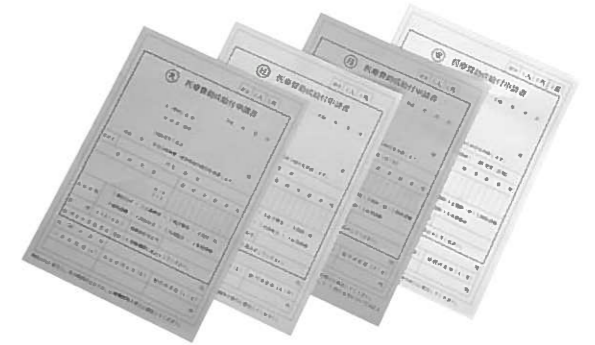
受診の際、医療機関に提出する医療費給付申請書