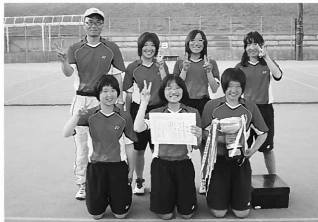
東北大会などで優勝した平泉中ソフトテニス部

平泉中学校ソフトテニス部（部員17人）が目覚ましい活躍を見せています。一時は部員数の減少で23年度以降の存続も危ぶまれていましたが、同部から全日本都道府県対抗中学生大会の県代表に選ばれた選手がいたことなどで注目が集まり、今春待望の新人部員7人が入部し、3年生10人、1年生7人で活動を開始しました。