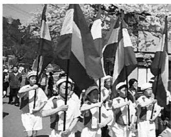
背筋を伸ばし、堂々と

「学校が近づいたとき、〇さんのニコッとした顔を見てしまいましたよ。長い距離をがんばりましたね。皆さんは、パレードをやり遂げた今、ほっとしていると思います。『やったあー』という気持ちを味わっていると思います。その気持ちを覚えていてください。その気持ちは、今までたくさんの練習を積み重ねてきたからこそ味わうことができます。今日の成功は、