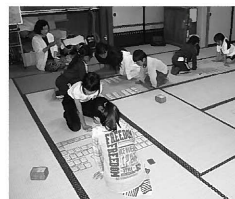
練習にはげむ子どもたちの目は真剣そのもの