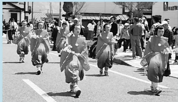
▲愛らしい牛飼童子の行列