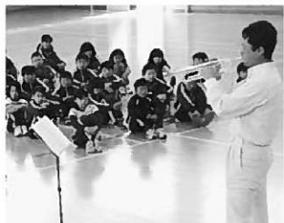
トランペットの演奏を聞き入る児童

トランペットをやろうと決めたこと。その後、どんな好きにならずとトランペットを続けてきたことや、仕事と両立しながらの活動で運営や練習など大変だけれど、好きな音楽をやっていることで、苦しいと感じることはないということ。さらに吹奏楽を通じて、自分の人生にとってかけがえのない人々との出会いもあり、吹奏楽は自分にとってなくてはならないものだということをとら