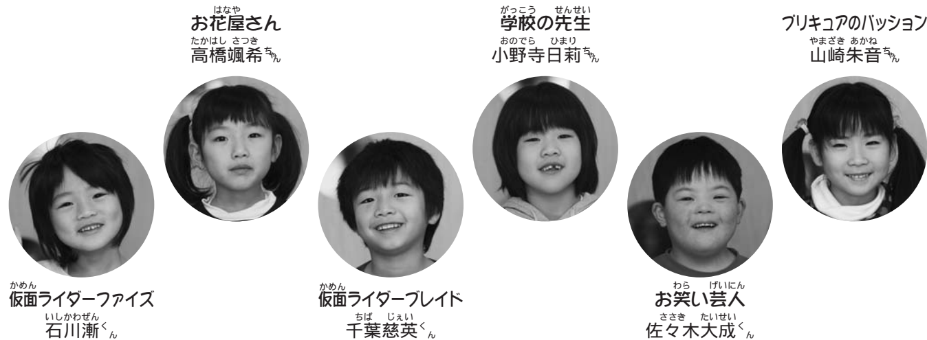
仮面ライダーファイズ 石川漸くん