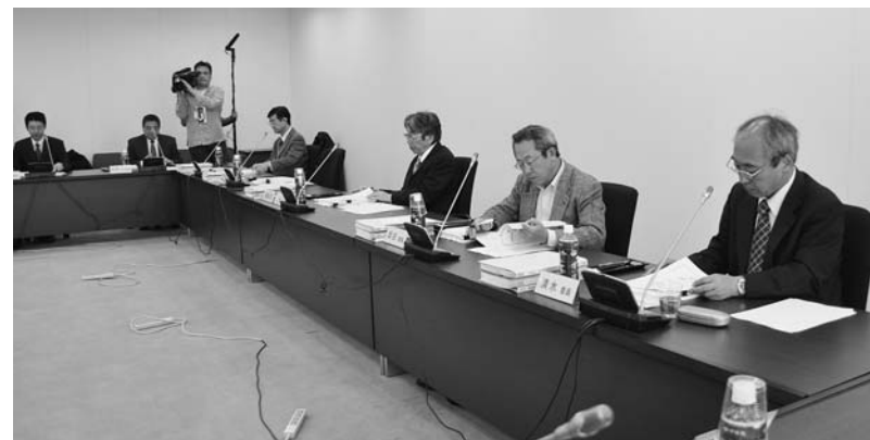
11月26日に中央合同庁舎で開かれた第8回推薦書作成委員会再チャレンジの推薦書に対して、委員の評価は非常に高い

ら頂いた具体的な助言に可能な限り対応した内容だと考えている。質的にも学問的にも前回より向上し、自信を持って審査していただける内容になった。2011年の世界遺産委員会でも及第点がもらえるだろう」として、今回の推薦書を高く評価しました。