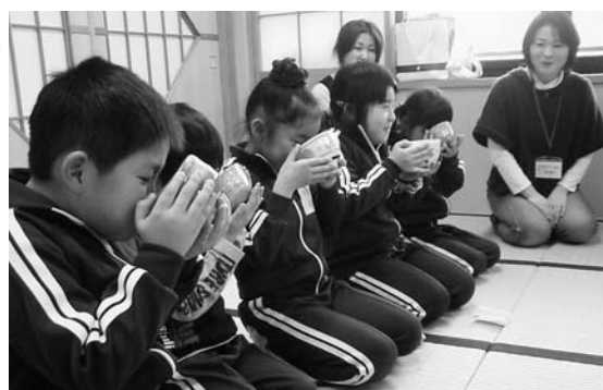
お抹茶をいただく子どもたち