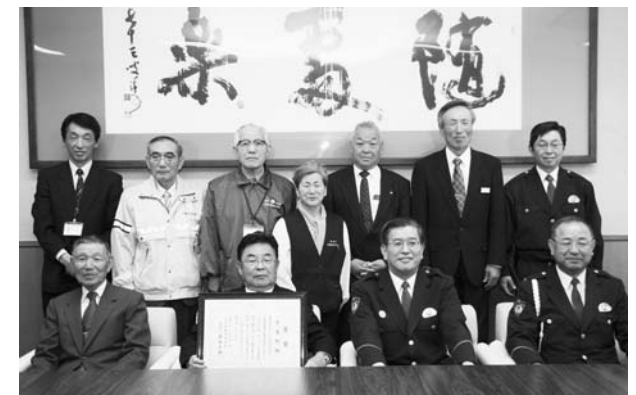
死亡事故ゼロ継続へ決意を新たにする関係者

今野署長は「今回の達成は、地域の地道な活動の成果であり、1年間は通過点として3年、4年と継続してほしい」と期待を寄せた。町長は今後さらに関係機関と一体となって、交通安全の推進に努めることを誓いました。