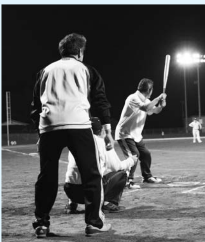
前回のオリンピックの様子

町民参加型スポーツの祭典、ふるさとオリンピックが2年ぶりに開催されます。前回までの競技種目を2カ年に分け、本年度は下記の6種目で競技を実施します。皆さんぜひご参加ください!