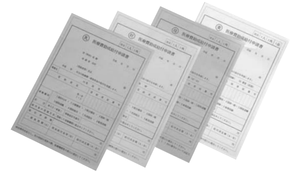
受診の際、医療機関に提出する医療費給付申請書

同じ月内に内科と歯科の両方を受診する場合 同じ月内に入院診療と外来診療が生じた場合