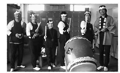
山王太鼓のメンバー

胸を打つ太鼓の響き。発足10年を迎えた山王太鼓では、新しいメンバーを募集しています。ぜひ一度、私たちのけいこを見学に来てみてください。お待ちしております。 同時にマネージャーも募集しています。主にビデオの撮影や細かいお世話などを行っていただきますが、年間を通していろいろな所に行けるので楽しめるとおもいます。パソコンを使える方であれば最高です。