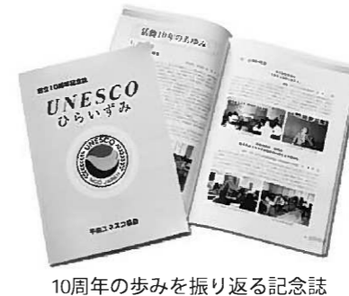
10周年の歩みを振り返る記念誌

記念誌は200部作製。会員や関係機関に寄贈するほか、希望者向けに若干部数を販売します。 ◎会員を募集しています 平泉ユネスコ協会では会員を募集しています。平成23年の世界遺産登録実現を目指して、ぜひ一緒に活動しましょう。 申し込み・問い合わせ先 平泉ユネスコ協会事務局 (教育委員会内) ☎46-5576